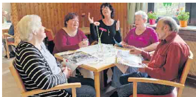
In einer Pflegeeinrichtung hat man täglich Abwechslung und ist immer in netter Gesellschaft - beim gemeinsamen Essen, bei Fitness oder Kartenspiel.

Größe im Bergischen Land und dem Kölner Umland ist, stellt sich und sein Pflegekonzept am 12.05.2023 mit einem Stand auf dem Sülzplatz in Rösrath vor. Die Mitarbeiter informieren von 10:00 bis 13:00 Uhr umfassend