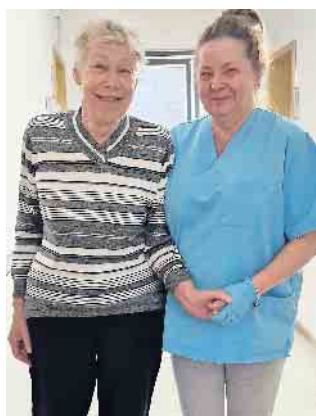
Die Begleitung einer vertrauten Pflegerin gibt Sicherheit

Ein erster Schritt den Berufen der Pflege mehr Anerkennung zu schenken, aber noch keine Lösung des Problems. Alle interessierten Besucher sind herzlich willkommen, sich am Stand mit den Mitarbeitern des Hauses Kleineichen auszutauschen.