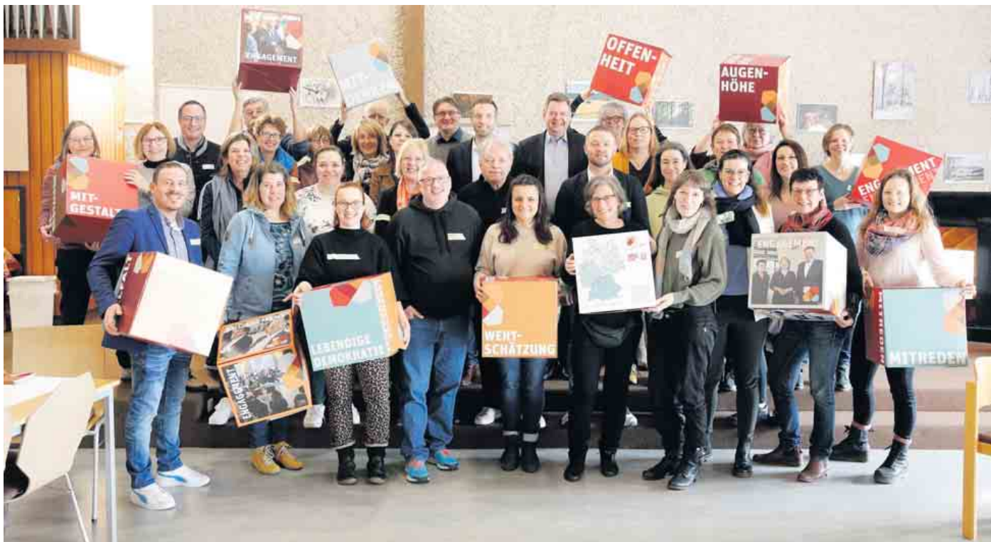
Netzwerktreffen der Engagierten Städte in Offenbach: Auch Rösrath war dabei.

Mal über den Tellerrand zu schauen, macht Spaß und bringt immer neue Erkenntnisse: So auch beim Austauschtreffen des bundesweiten Netzwerkprogramms der „Engagierten Stadt“ in Offenbach, bei dem auch die Engagierte Stadt Rösrath vertreten war. Beim „Zwischenstopp“ ging es darum, die Zusammenarbeit zwischen Städten zu fördern und den Austausch