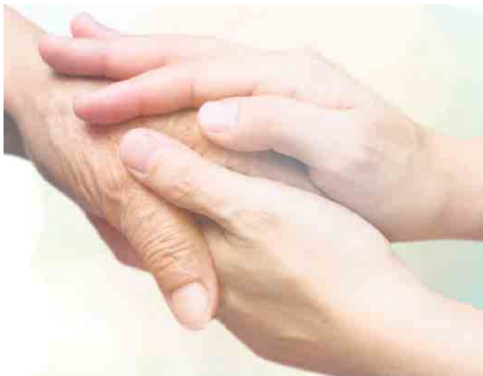
Die Pflege ist eine Aufgabe für 24 Std am Tag

Meist sind es die Angehörigen, die die Pflege zu Hause übernehmen. Doch sie stoßen irgendwann an ihre psychischen und physischen Grenzen. Auch wenn sie Unterstützung durch kompetente ambulante Pflegedienste erhalten, die täglich wichtige Aufgaben wie zum Beispiel Körperpflege und medikamentöse Versorgung abdecken, ist oft irgendwann der Zeitpunkt erreicht, an dem die Betreuung in den eigenen vier Wänden beim besten Willen von den Familienangehörigen nicht mehr geleistet werden kann. Insbesondere bei Menschen mit fortschreitender Demenz führt