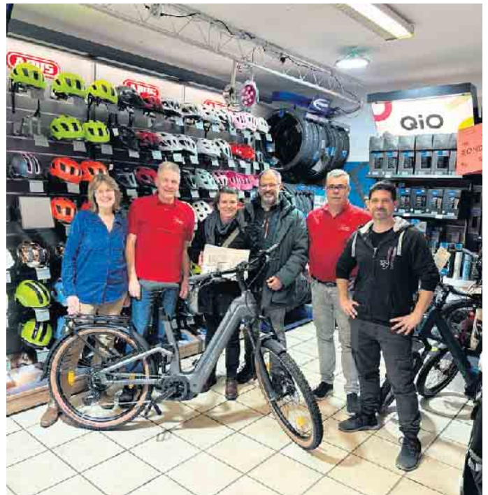
Freuten sich riesig über ihr neues E-Bike: Die Gewinner (Mitte) mit Vertretern von GfR, IG Forsbach und dem Overather Fahrradladen.