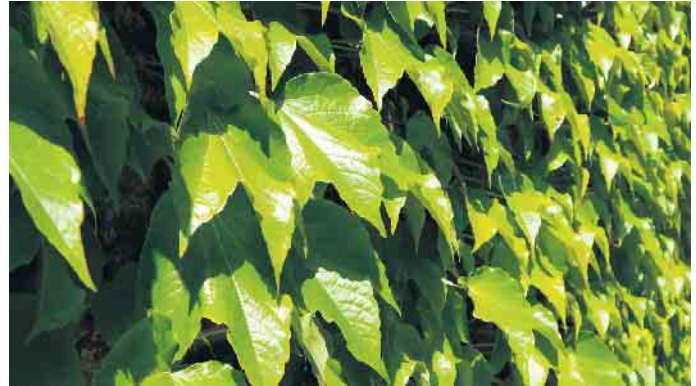
Die klassische Art der Fassadenbegrünung: Wilder Wein wächst an einer Hauswand.

Der VFF betont daher: Eine Fassadenbegrünung kann ein sinnvoller Beitrag zum Klimaschutz und zu einem angenehmeren Wohnumfeld sein. Voraussetzung sind jedoch eine fachkundige Beratung, eine sorgfältige Planung und ein klares Pflegekonzept. Wer diese Punkte berücksichtigt, kann die Vorteile nutzen und spätere Probleme vermeiden.