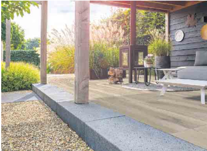
Tolle Kombi: EXEO®-Stufen und PURITY®-Feinsteinzeugplatten - hier im Farbton Nature Brown - in edler Holzoptik.

Struktur von Basaltlava und erzeugt Flächen von einzigartiger Natürlichkeit, die den Außenbereich enorm aufpeppen. Die Megaformate von bis zu 200 x 100 x 10 cm bei Platten und Schwebestufen ermöglichen viel kreativen Spielraum - nicht nur beim Terrassenbelag, sondern ebenfalls bei der Gestaltung von Hauseingängen, Einfahrten, Hochbeeten, Stufenanlagen oder Stelen. Wie XXL-Bauklötze lassen sich die Einzelemente außerdem prima miteinander kombinieren, sodass attraktive Gartenensembles ent-