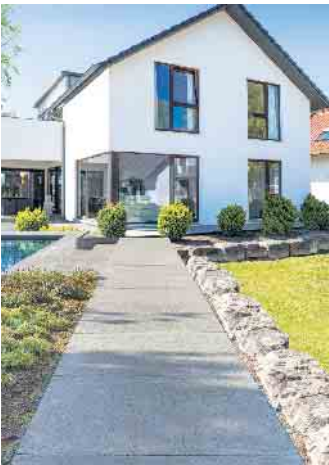
EXEO®-Platten im Megaformat können direkt im Splittbett verlegt werden. Die großzügigen Flächen punkten mit einem geringen Fugenanteil.

sen einen offenen, großzügigen Charakter erhalten. Weitere Informationen zu den designstarken EXEO®-Elementen und den vielseitigen Gestaltungsmöglichkeiten erhalten Interessierte unter www.koll-steine.de/exeo-platten . CSH