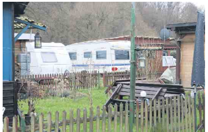
Fernab von Großstadtlärm - Camping an der Sülz.

Erfahrungen auf diesem Campingplatz „im Sölztal“ im „Camping Leed: Do laachs do dich kapott, dat nennt m’r Camping“, humorvoll verarbeitet haben. Dem Liedtext zufolge war für ihn damals vermutlich das Thema Camping abgehakt. Die heutigen Camper dagegen genießen Ruhe und Entspannung am Ufer der Sülz. Text von Helmut Kurps