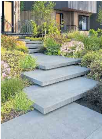
EXEO®-Elemente eignen sich nicht nur als Terrassenbelag, sondern auch für die Gestaltung von Hauseingängen und Stufenanlagen.