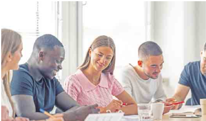
Die kompakten Lehrveranstaltungen finden in einem der Studienzentren der Hochschule statt. Foto: DJD/DHfPG

Das Hobby zum Beruf machen: Aufgrund der wachsenden Bedeutung der Zukunftsbranche Gesundheit und Fitness kann sich eine Qualifizierung in Berufen rund um Fitness- und Gesundheitstraining lohnen. Foto: DJD/DHfPG