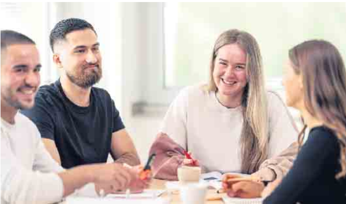
Die dualen Bachelor-Studiengänge bestehen aus einem Fernstudium in Kombination mit kompakten Lehrveranstaltungen.

Mit einer dualen Ausbildung im Bereich Fitness und Gesundheit durchstarten