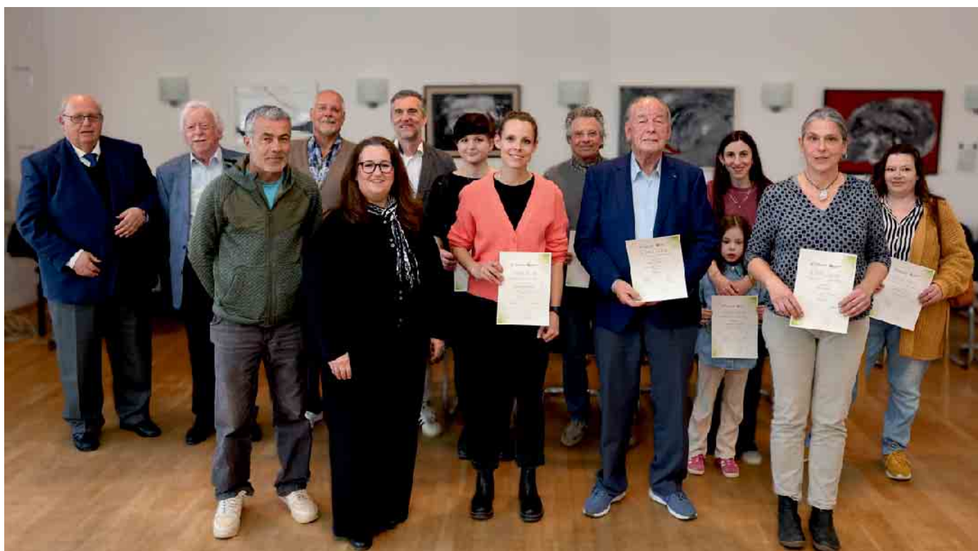
Gruppe bei der Abschlussveranstaltung und Preisverleihung im Bürgersaal: Die Teilnehmenden des Wettbewerbs gemeinsam mit Vertretern der Stadt und der Bürgerstiftung Rösraht.

Abschlussveranstaltung mit Preisverleihung