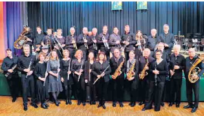
Sülztaler Blasorchester Rösrath e. V.

Schule in Rösrath. Wie es sich für ein „Silberhochzeits-Konzert“ gehört, erwarten Sie viele Highlights aus verschiedenen Musikrichtungen - Sie dürfen gespannt sein, welche Überraschungen wir zusätzlich bereithalten. Wir beginnen um 16 Uhr (Einlass ab 15.30 Uhr) - Eintrittskarten zum Preis von 15 Euro (Kinder und Jugendliche unter 18 Jahren frei) sind bei allen Mitgliedern, unter www.suelztaler-blasorchester.de sowie an der Abendkasse erhältlich.