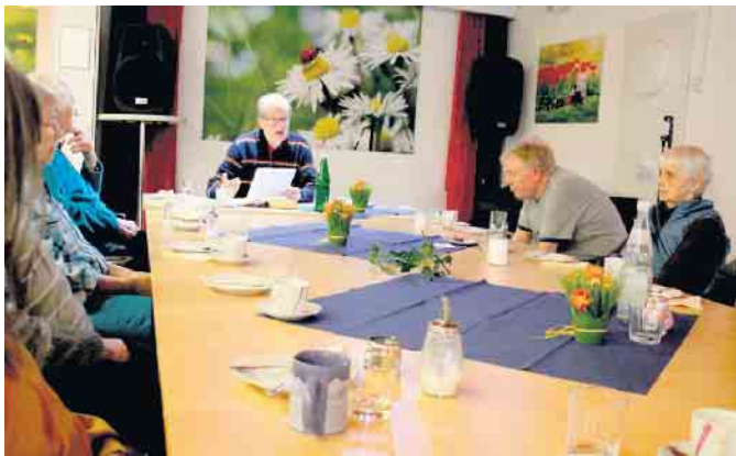
Anregende Diskussionen zum Zeitgeschehen und zu persönlichen Themen werden von den Teilnehmer*innen in der lebendigen und geselligen Runde gerne aufgenommen.

Das Haus Kleineichen ist sehr dankbar für das Engagement von Herrn Brodersen, der die Themen für den Gesprächskreis sehr sorgfältig und gut verständlich ausarbeitet und inzwischen einen ausgesprochen