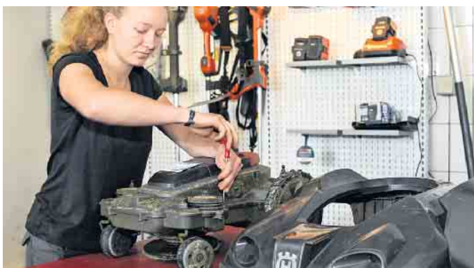
Bei mechatronischen Berufen stehen Wartung und Reparatur von Garten- und Outdoorgeräten im Mittelpunkt.

Neben einer fundierten Ausbildung bieten Motoristenbetriebe ihren Azubis bei einem erfolgreichen Abschluss attraktive Perspektiven - angefangen von einer Übernahme bis hin zu vielfältigen Weiterbildungs- und Aufstiegschancen. „Ob Vier-Tage-Woche oder doch lieber Karriere bis hin zur Selbstständigkeit, die Motoristenbranche hält viele Chancen bereit“, so Oliver Hütt weiter. Da gut jeder vierte Betrieb in den nächsten fünf bis zehn Jahren einen Nachfolger oder Geschäftsführer suche, seien die Karriereperspektiven sehr gut. Unter www.greenbase.de etwa gibt es mehr Details dazu, zudem lassen sich hier örtliche Motoristenbetriebe finden. Ein Praktikum vor der Entscheidung für eine Berufsausbildung ist immer eine gute Idee. Angehende Fachkräfte in diesem Bereich werden spannende Entwicklungen hautnah miterleben: Der Wandel vom Verbrennungsmotor hin zu ökologisch nachhaltigen Antrieben sowie der Trend zu Robotertechnologie macht auch vor dieser Branche nicht halt und sorgt für neue Herausforderungen, gerade für die junge Generation. (DJD)