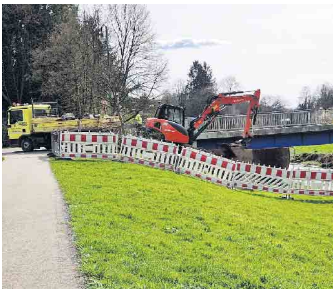
Am östlichen Ufer der Brücke „Volberg“ haben die Arbeiten begonnen. Hier werden die baufälligen Flügelwände entfernt.

Fußgänger, Rad- und Autofahrer passierbar. Seit Montag, 25. März, dem ersten Tag der Osterferien, wird im weiteren Verlauf der Arbeiten allerdings der Bereich um die Brücke gesperrt. Die Brücke selbst bleibt für Fußgänger frei. Die Fahrbahn über die Brücke sowie der Sülzdammweg werden hingegen gesperrt. Entsprechende Umleitungen werden eingerichtet und entsprechend ausgeschildert. Diese gilt es zu beachten. Die Stadt bittet für etwaige Unannehmlichkeiten um Verständnis. Die ausführende Firma geht von einer rund 14-tägigen Bauzeit aus. Für die Zeit der Sperrung wurde bewusst die Zeit der verkürzten Osterferien gewählt.