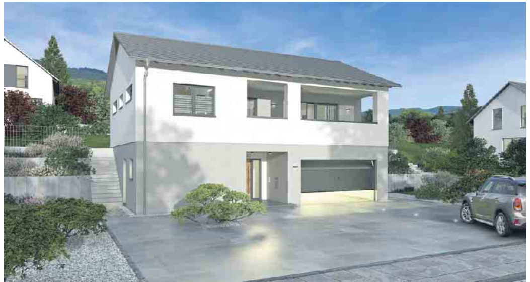
Ein Wohnkeller ist ein sicheres und komfortables Fundament für einen effizienten Hausbau am Hang.

Die meisten Grundrisse bei Einfamilienhäusern sehen im Erdgeschoss die Gemeinschaftsräume zum Kochen, Essen und Wohnen vor, und im Obergeschoss Schlaf-, Kinder- und Badezimmer. „Ein Hausbau am Hang lädt dazu ein, diese klassische Aufteilung neu zu denken“, so Wetzels. Zum Bei-