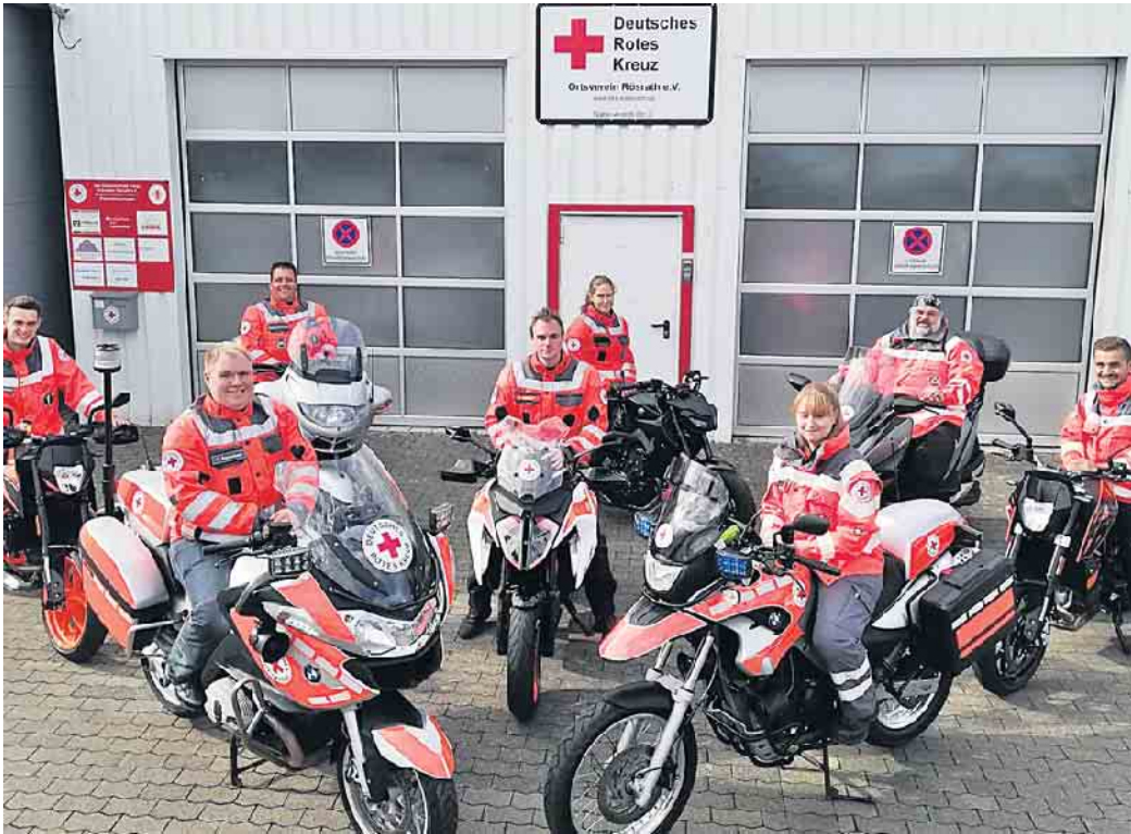
Mit Motorrädern schneller und flexibler im Einsatz.

Rösraht (ku). Der DRK-Ortsverein Rösraht e.V. hat eine lange Tradition. Schon seit 1921 engagieren sich Menschen in und um Rösraht für das Deutsche Rote Kreuz. Derzeit zählt der Ortsverein mit Sitz in der Walter-Ahrendt-Str. 160 aktive Mitglieder, davon rund 70 in der Jugendabteilung. Sie engagieren sich vor allem im Sanitätsdienst, im Jugendrotkreuz, in der humanitären Hilfe und im Katastrophenschutz. Bei Konzert, Fußballspiel, Karnevalsanzug oder Straßenfest - wo viele Menschen zusammenkommen, gibt es viele kleine und größere Notfälle. Ob ein Kind sich das Knie aufschürft