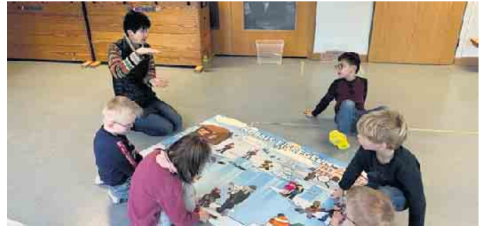
Kinder beim Eisregel Puzzle