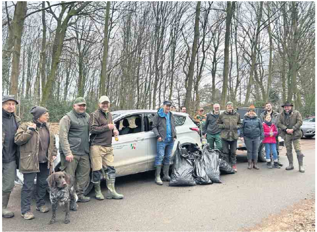
Rösrather Jäger haben viel Müll beseitigt

Nach knapp zwei Stunden Suche präsentierten die Waidleute ihre reiche Beute: neben gut 100 Kilogramm Abfall aller Art konnten drei alte Autoreifen und - als besonderer Umweltfrevel - eine Autobatterie beseitigt werden. Zudem wurde auch eine Geldbörse gefunden, die zwar eigentlich nur noch eine Börse war (weil alles Geld fehlte), aber sie enthielt noch Dokumente und Papiere. Die Polizei wird sie ihrem Eigentümer demnächst zurück geben.