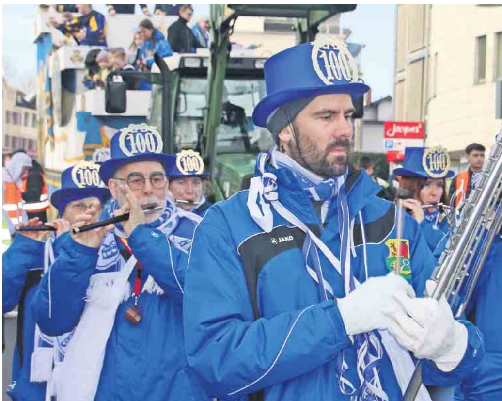
Das Tambourkorps Bau-Weiß Rösrath blies auch im hundertsten Jahr den Jecken kräftig den Marsch.