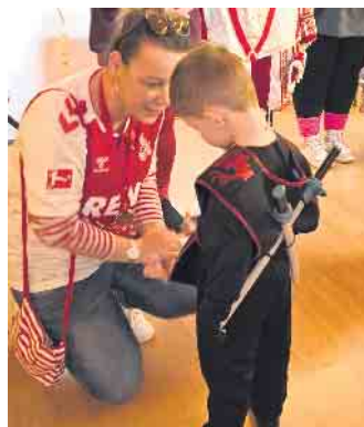
Fr. Granja mit Kinderbesuch