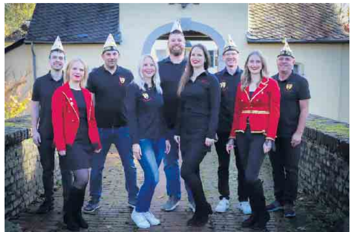
Vorstand der Bürgergarde Rösrath

„Um den karnevalistischen Nachwuchs frühzeitig zu fördern, haben wir zum Beispiel 2017 eine Jugendtanzgruppe gegründet. Kinder und Jugendliche lernen hier nicht nur die Grundlagen des Gardetanzes, sondern auch die Traditionen und Werte des rheinischen Karnevals kennen.“ Die Jugendtanzgruppe besteht aktuell aus rund 25 Tänzerinnen und Tänzern im Alter von 10 bis 16 Jah-