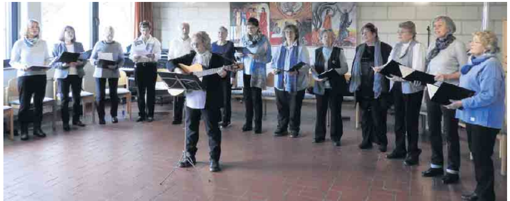
Frauenchor Forsbach 1988 e.V.

„Schön ist's im Winter“ - Konzert zum Zuhören und Mitsingen war der Titel, unter dem der Frauenchor Forsbach 1988 e.V. sein erstes Konzert nach den Corona-Einschränkungen veranstaltete. Obwohl der Chor nur noch aus 16 aktiven Sängerinnen besteht, hatte Chorleiterin Elvira Goebel ein abwechslungsreiches Programm mit Liedern, die sich mit dem Thema „Winter“ oder „Frieden“ befassen, zusammengestellt. Die Sängerinnen eröffneten das Konzert mit der „Petersburger Schlittenfahrt“, die auch dem Konzert den Namen gab. Nach dem „Andachtsjodler“, einer Volksweise aus Südtirol, wurde das Publikum aufgefordert, bei Liedern wie „Es ist für uns eine Zeit angekommen“ und „Schneeflöckchen, Weißbäckchen“ mitzusingen.