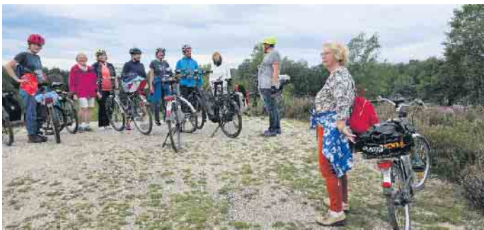
Fahrradtour im Sommer