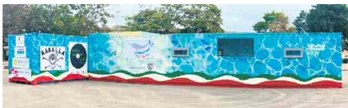
Außenansicht des „narwali“ Schwimmcontainers, der von Leverkusen nun nach Rösrath kommt.

An seinem bisherigen Standort in Leverkusen wird der Schwimmcontainer bereits für die Weiterfahrt nach Rösrath vorbereitet. Der Aufbau des Containers auf dem Freibadparkplatz in Hoffnungsthal soll am kommenden Wochenende beginnen, sodass der Parkplatz bereits ab Donnerstagnachmittag, 23. Januar, voll gesperrt und bis voraussichtlich Ende März nicht mehr als solcher zur Verfügung stehen wird. Stadt und StadtWerke bitten um Beachtung. Nach Abschluss der notwendigen Aufbau- und Vorbereitungsarbeiten wird der Schwimmcontainer