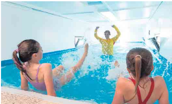
Blick ins Innere des Schwimmcontainers: Er bietet eine Wasserfläche von 11,5 x 2,8 Metern bei einer Wassertiefe von 0,9 bis 1,3 Metern.

Die Wasserfläche im Schwimmcontainer beträgt 11,5 x 2,8 Meter bei einer Wassertiefe von 0,9 bis 1,3 Metern. Die Wassertemperatur liegt bei 30 Grad. Auch Umkleidemöglichkeiten sowie sanitäre Anlagen stehen für die Nutzer zur Verfügung. „Auch wenn ein Schwimmcontainer nicht das klassische Schwimmbadangebot ersetzen kann, ist er ein ergänzendes Angebot der Wassergewöhnung und somit ein wichtiger Baustein, um die Schwimmfähigkeit von Kindern zu erhöhen“, so Bürgermeisterin Bondina Schulze.