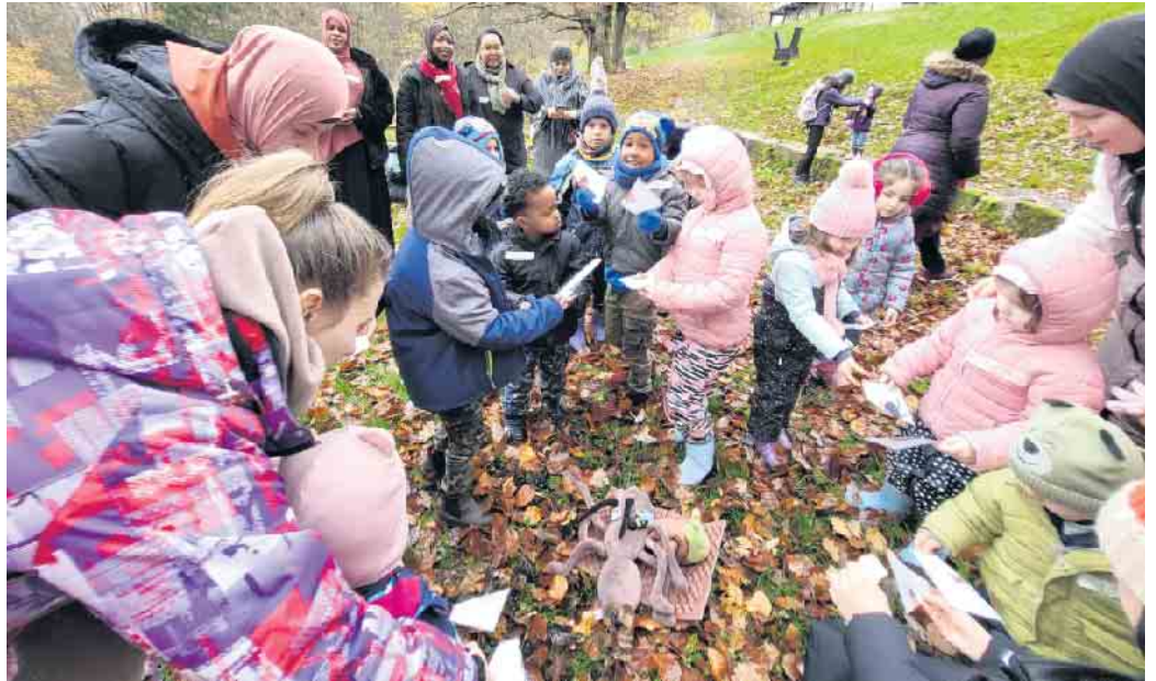
Die Kinder und ihre Mütter nahmen die Natur genau unter die Lupe.