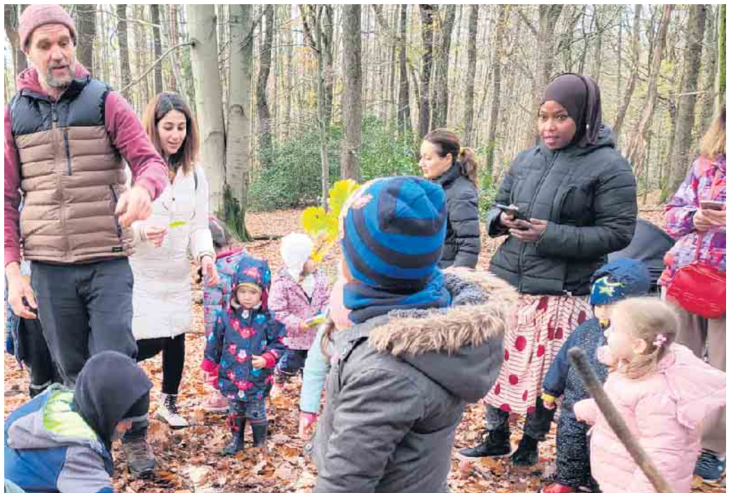
Gemeinsam mit einem Naturpädagogen beschäftigten sich Kinder und Eltern mit Eichhörnchen und ihrem Lebensraum.

Kinder im Alter zwischen einem und drei Jahren. Das Programm wird in Kindertageseinrichtungen, Familienzentren oder Familienbildungsstätten angeboten. „Griffbereit“ fördert die frühkindliche Entwicklung durch kleinkindgerechte Aktivitäten mit den Eltern, wie beispielsweise gemeinsames Spielen, Singen oder Malen in den Familiensprachen und auf Deutsch. Dies schafft eine wichtige Grundlage zum Erwerb von