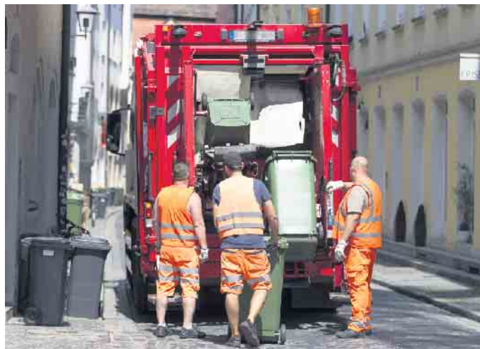
Jobrisiko Sonne: Beschäftigte in Außenberufen sind besonders gefährdet für hellen Hautkrebs.

mit der Sonne wichtig. Tipps hierzu auch auf www.actinicalotion.com . So ist es sinnvoll, sich gerade in der warmen Jahreszeit einen Trick der Südeuropäer abzuschauen: Diese halten in der Mittagszeit eine lange Siesta und sind so weniger Risiko durch die UV-Strahlung ausgesetzt. Zumindest sollte in diesen Stunden die Arbeit in den Schatten verlegt werden. Hier sind auch Arbeitgeber in der Pflicht, die außen liegenden Arbeitsstellen abzuschirmen beziehungsweise zu überdachen. Und nicht zuletzt können sorgfältige Selbstbeobachtung und regelmäßige Vorsorgeuntersuchungen beim Hautarzt helfen, Hautkrebs möglichst frühzeitig zu entdecken und behandeln. (DJD)