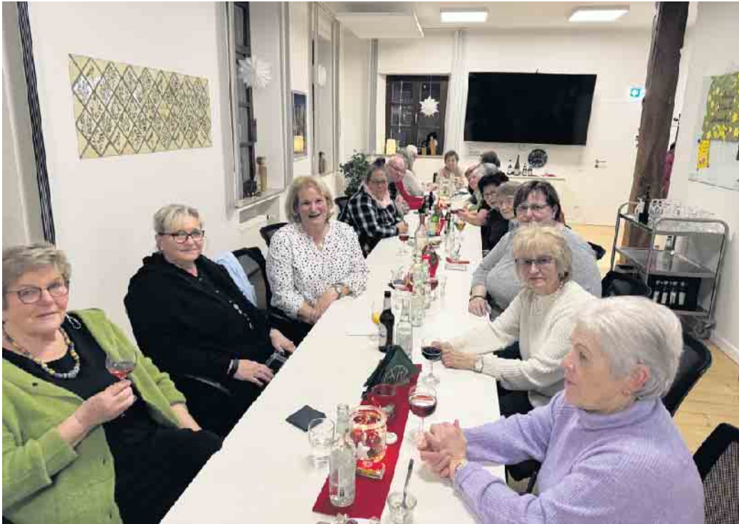
Die Helferinnen und Helfer in der Seniorenarbeit in der Gemeinde Rheurdt

Im Rahmen eines Bürgerentscheides hatten die Bürgerinnen und Bürger im Kreis Kleve die Mög-