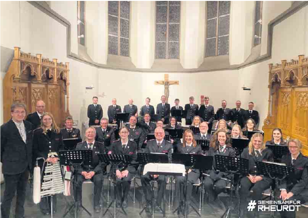
Spielmannszug Freiwillige Feuerwehr Rheurdt

Der Spielmannszug, der sonst vor allem für seine Marschmusik bekannt ist, überraschte das Publikum mit Stücken wie „Highland Cathedral“ und „Drei Nüsse für Aschenbrödel“. Rückmeldungen der Gäste wie „Tränen in den Augen“ und „Gänsehaut“ zeigen mehr als deutlich, dass sich die Mühe unserer Proben absolut gelohnt. Das Feedback bestärkt darin, das Tradition gewordene Adventskonzert in Rheurdt alle zwei Jahre fortzuführen.