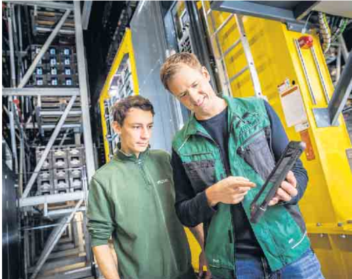
Die Ausbildung zur Fachkraft für Lagerlogistik in der Brauerei dauert drei Jahre, Voraussetzung ist ein Hauptschulabschluss.