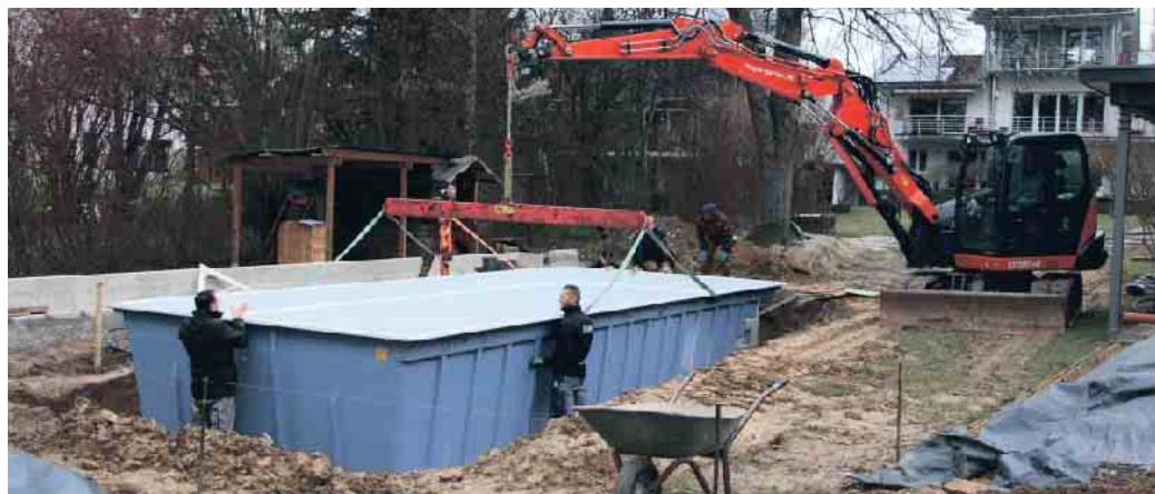
Teamwork auf der Baustelle.

gebote aus der Schwimmbadbranche findet man auf der Website des Bundesverbandes Schwimmbad & Wellness e.V. (bsw) unter www.bsw-web.de . (akz-o)