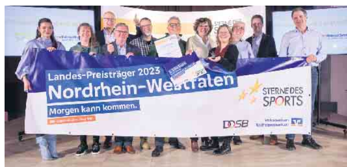
Schwimmfreunde Rheurdt bei der Preisverleihung

Bereits im September hatten die Schwimmfreunde auf regionaler Ebene den ersten Platz im Wettbewerb belegt und sich als Preisträger „Sterne des Sports - Bronze“ automatisch für den NRW-Landeswettbewerb qualifiziert. Nun wur-