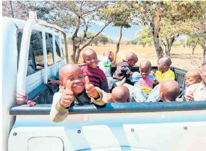
Gut gelaunte Kinder

15 Jahre Kinderdorf Mbigili in Tansania bedeuten auch, dass einige junge Erwachsene in diesem Jahr ihre Ausbildung abschließen und ein eigenständiges Leben meistern