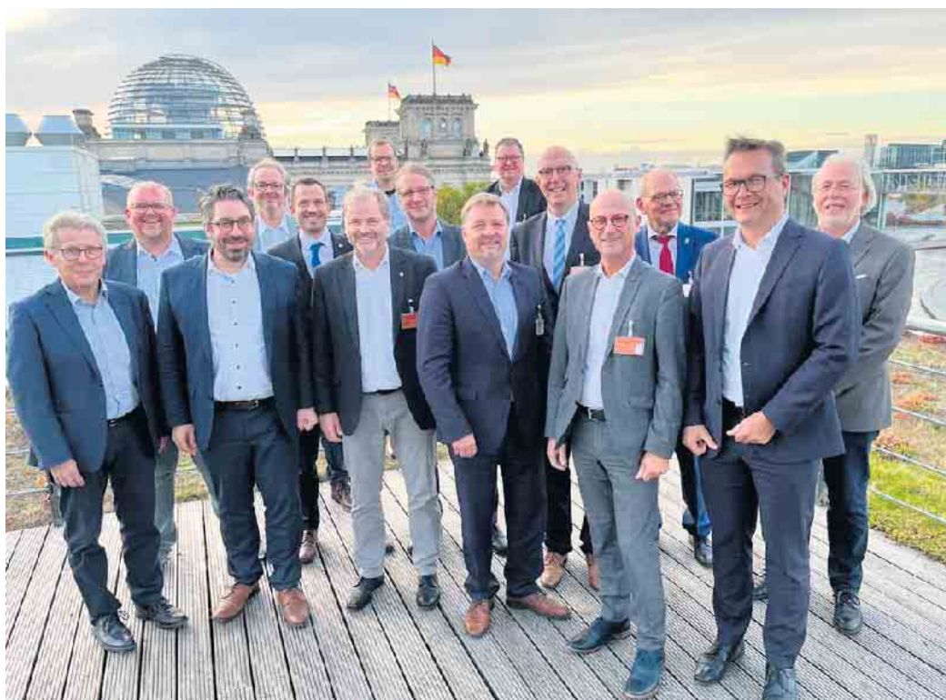
Bürgermeister in Berlin

Gemeinsam mit meinen Bürgermeisterkollegen aus 12 weiteren Kommunen des Kreises Kleve war ich vom 23.-25.10.2022 in Berlin. Hintergrund der gemeinsamen Fahrt waren u.a. dringend notwendige Gespräche in verschiedenen Ministerien. Am 24.10. waren wir zunächst im Bundesministerium für Wirtschaft und Klimaschutz. Dort hatten wir die Gelegenheit mit der parlamentarischen Staatssekretärin Franziska Brantner u.a. über die Aufnahmesituation der Geflüchteten und über den Ausbau erneuerbarer Energien zu sprechen. Unmittelbar nach diesem Termin waren wir im Bundesministerium für Digitales und Verkehr. Gemeinsam mit dem parlamentarischen Staatssekretär Michael Theurer haben wir uns u.a. über den Ausbau des Schienenverkehrs im Kreis Kleve beraten. Abschließend haben wir uns an diesem Tag mit Uwe Lübking vom Deutschen Städte- und Gemeindebund getroffen, um über die kleinen und großen Probleme der Kommunen zu beraten. Begleitet wurden wir von Stefan Rouenhoff, Bundestagsabgeordneter für den Kreis Kleve. Am 25.10. hatten wir, auf Einladung des haushaltpolitischen Sprechers der FDP-Fraktion, Otto Fricke MdB, eine Führung durch den Bundestag. Anschließend haben wir gemeinsam mit Otto Fricke u.a. über Förderprogramme (z.B. Sportstätten-Förderung, Förderung Glasfaser-Ausbau) beraten und uns über aktuelle bundespolitische Themen ausgetauscht. In allen Terminen war die nicht auskömmliche Finanzierung der Kommunen Inhalt und wir konnten gemeinsam unseren Standpunkt vermitteln, dass