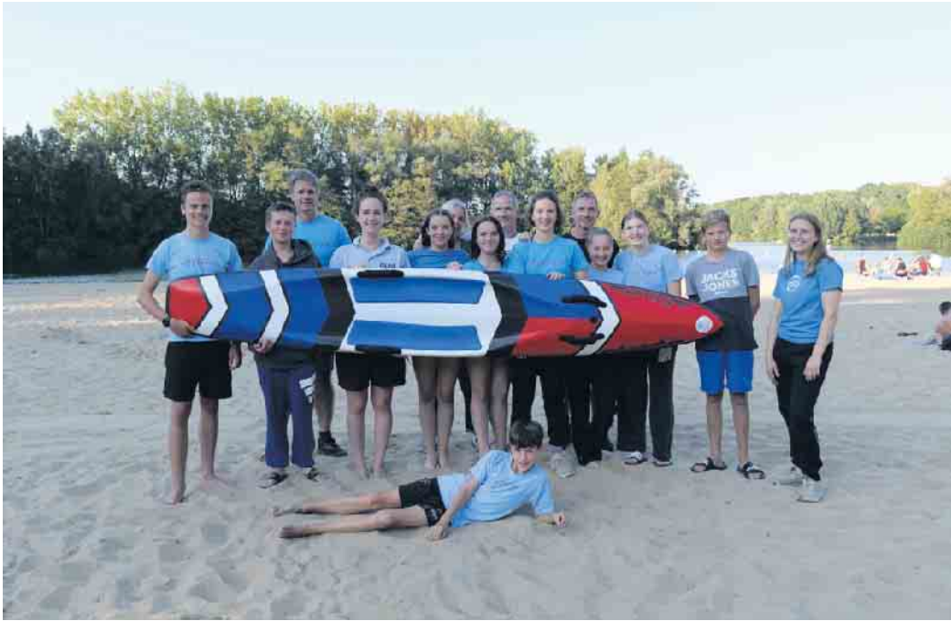
Das Team beim Albersseecup

Im September nahm die DLRG Rheurdt-Schaephuysen mit Erfolg an zwei Freigewässerwettkämpfen teil. Die Landesmeisterschaften im Freiwasser fanden vom 6. bis 8. September am Stemmer See in Kalletal statt. Der AlbersSee-Cup wurde wie jedes Jahr in Lippstadt am 21. September abgehalten. Insgesamt gingen sechs Teilnehmende bei den Landesmeisterschaften sowie neun Teilnehmende beim AlbersSeeCup an den Start. Glücklicherweise spielte das Wetter in diesem Jahr perfekt mit, sodass das Team motiviert und mit viel Freude an den Wettkämpfen teilnahm. Neben dem sportlichen Einsatz blieb genügend Zeit, das sonnige Wetter am Strand zu genießen und im Team zusammenzusitzen. Die Wettkämpfe stärkten den Teamgeist der Gruppe. Besonders die Olympicstaffel beim Albers-SeeCup, bei der acht Teilnehmende gemischt aus allen Altersklassen als Mannschaft antraten,