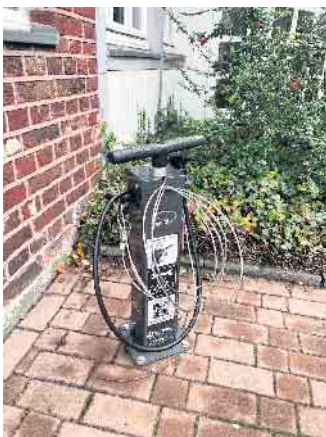
Fahrradreparaturstation Haus Quademchels

Marcel Ponten Rathausstraße 35 47509 Rheurdt Tel: 02845 / 96 33 - 64 marcel.ponten@rheurdt.de