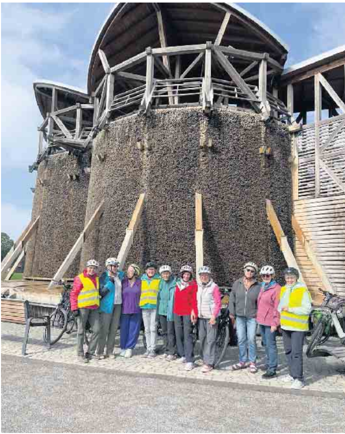
Spaß hoch zehn!

sium mit einer interessanten Geschichte. Die Mittagspause sollte im Traberpark „Den Heyberg“ stattfinden. Dort wurde in den 80er-Jahren ein riesiges Munitionsdepot angelegt. 325 Bunker gleichen Stils gab es zu bestaunen. Als die Militäranlage aufgegeben wurde, hat man die Bunker für private Zwecke freigegeben, z. B. als Lagerhäuser, Pferdeställe, Pilzzucht, Ferienhäuser, etc. Wir durften einen Blick in ein Privathaus werfen. Sehr interessant! Nach dem Picknick fuhren wir nach Walbeck, an der Steprather Mühle und an der Kokermühle vorbei, dann weiter nach Pont, vorbei am Haus Ingenray bis nach Venum, wo wir im Cafe Steudle Kaffee und leckeren Kuchen genießen konnten. Die Verlierer des Abendspiels gaben zum Abschluss noch eine Runde erfrischenden Federweißen für alle aus. Zufrieden radelten wir die letzten Kilometer zurück nach Hause. Eine sehr schöne, problemlose Tour lag hinter uns. Hoffen wir auf weitere interessante Touren in den nächsten Jahren!