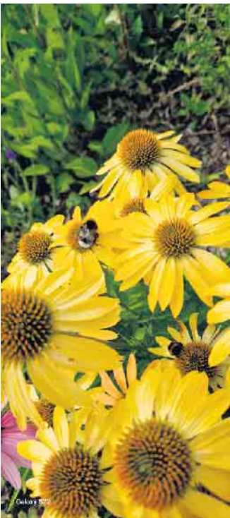
1. Platz von Sabrina Pietrzak