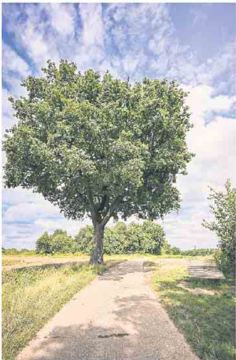
2. Platz von Markus Schneider