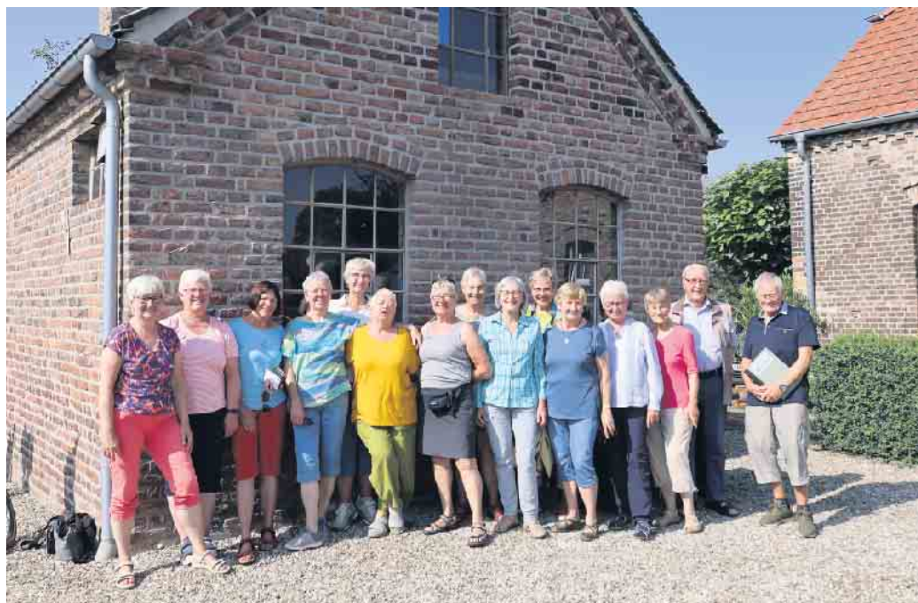
Gemeinsam vor der „Alten Schmiede“ in Menzelen-Ost

Zum ersten Mal seit 30 Jahren sind wir ohne Regencapes losgefahren. Es war sehr, sehr heiß. Aber auf dem Rad ließ sich die Hitze noch am besten aushalten. Das Ziel der diesjährigen Radtour hieß XANTEN. Am Samstag, 9. September, fuhren wir (14 Turnerinnen) auf schönen Waldwegen durch die Leucht nach Alpen und weiter zur Burg Winnenthal. Wir staunten über die große, gepflegte Anlage. Weiter ging es zur „Alten Schmiede“ nach Menzelen-Ost, wo wir eine detaillierte Führung bekamen, verbunden mit einer liebevollen Versorgung. Der Weg führte uns weiter an der Wallfahrtskirche in Ginderich vorbei nach Perrich zum üppigen Picknick in den außergewöhnlichen Pavillons am See. Unser guter Engel Waltrud erwartete uns dort schon mit frischem Kaffee. Gut gestärkt ging es weiter durch das Naturschutzgebiet Bislicher Insel. Hier beneideten wir die Wasserbüffel, die sich in den großen Wasserlöchern abkühlen konnten. In Lüttingen bestaunten wir die Statue eines jungen Mannes. Fischer hatten sie 1858 im Rhein gefunden. Das Original in Bronze steht jetzt im Pergamonmuseum in Berlin. Dann radelten wir weiter um die, an diesem Tag besonders stark besuchte, Xantener Südsee bis zu unserem Hotel. Nach dem