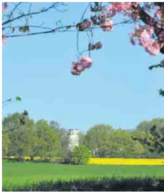
Mühle Schaephuysen Vorderseite

die Bäume inzwischen zusammen- gewachsen sind.