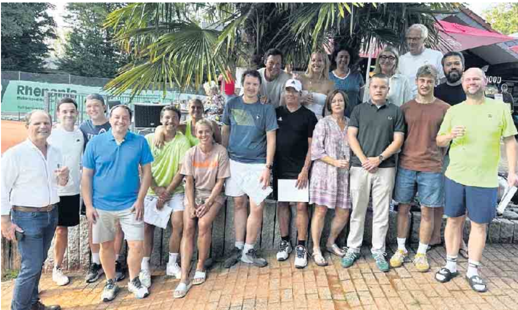
Clubmeisterschaften 2024 in Schaephuysen