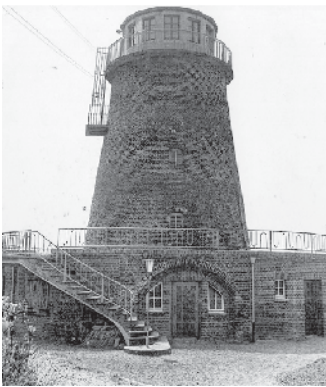
Postkarte um 1950

Absicht ist zu begrüßen, sofern man das Gebäude möglichst so stehen lässt, wie es ist; denn die Windmühlen auf den niederrheinischen Hügeln bilden ein Wahrzeichen der ganzen Landschaft, die mit dessen Verschwinden ein gut Teil ihrer Eigenart verlieren würde.“ Der ehemalige Kreis Moers kaufte die Schaephuysener Mühle zuvor am 12.08.1924. Seit 1974 ist die Mühle nun Jugendbildungsstätte und feierte am 1. Mai dieses Jahres ganz groß ihr 50jähriges Bestehen. Auf dem aktuellen Bild sehen wir den Blick von der Straße Lind in Richtung der Mühle. Diesen Blick gibt es „leider“ nicht mehr, weil