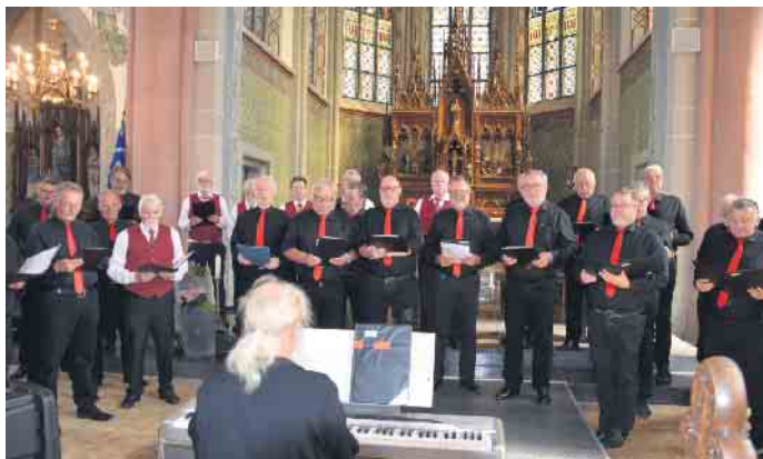
Der MGV Cäcilia

Endlich, nach einer gefühlten Ewigkeit konnte der MGV Cäcilia Schaephuysen mit Unterstützung der befreundeten