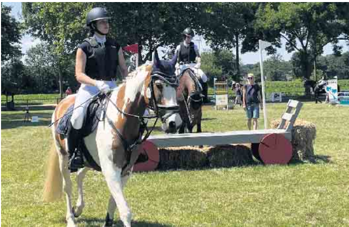
Zeigen der Hindernisse