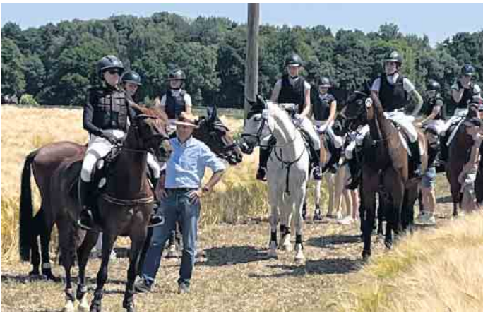
Streckenbesichtigung hoch zu Pferd

Turniertag für Vielseitigkeit an Fronleichnam