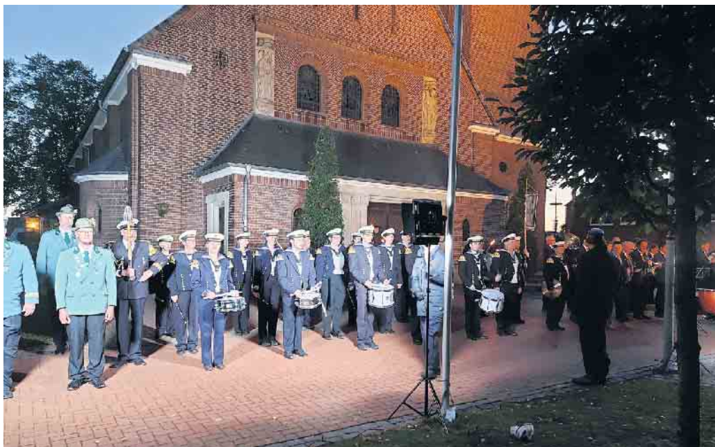
Der Spielmannszug beim „großen Zapfenstreich“ in Twisteden 2022

Feuerwehr schon bei den Übungsabenden. Denn unserer Meinung nach ist der Zapfenstreich eine ganz besondere Zeremonie und verlangt einen entsprechenden Rahmen. Sowohl der Aufmarsch als auch die Serenade, meist drei Musikstücke gemeinsam gespielt von Spielmannszug und Blasorchester, sowie der Ablauf des Zapfenstreiches mit Kommandos, ist ein nicht alltägliches Erlebnis, auch für uns nicht. Der große Zapfenstreich hat zwar einen militärischen Ursprung und Ablauf, jedoch dient er im zivilen Bereich dazu, einem großen Fest oder Jubiläum einen würdigen Rahmen zu verleihen. Genau das ist dabei unser Ziel. Wir würden uns natürlich auch über Zuschauer aus unserem Dorf sehr freuen. Vielleicht findet ja auch der eine oder andere Gefallen an diesem schönen Hobby und möchte sich uns anschließen. Es ist gar nicht so schwer ein Instrument zu erlernen. Wir proben immer Freitags von 19.30 bis 21 Uhr im Pfarrheim Schaephuysen. Wir freuen uns auf Euch, kommt doch einfach einmal vorbei!