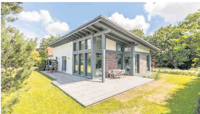
Fertighäuser werden nach den individuellen Wünschen und Bedürfnissen des Bauherrn geplant - vom kompakten Bungalow bis hin zur großen Stadtvilla.

47506 Neukirchen-Vluyn • Inneboltstraße 103 • Gewerbepark Vluyn Süd Telefon 0 28 45 - 2 89 26 + 2 89 06 • www.ladocsi.de