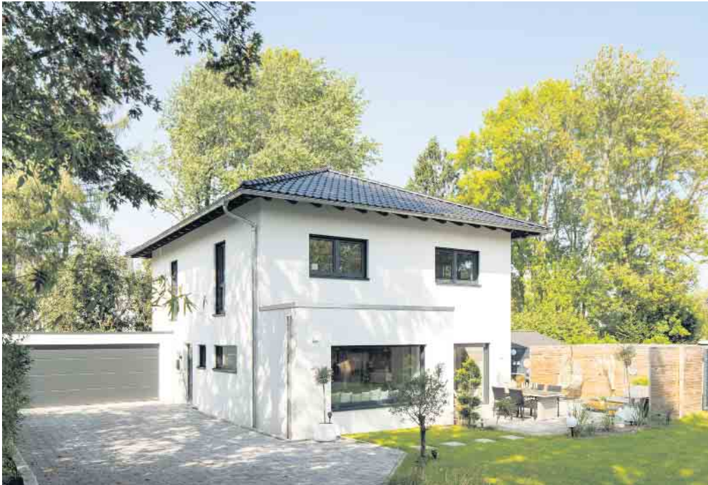
Die hohe Energieeffizienz moderner Holz-Fertighäuser hilft der Umwelt und spart Energiekosten.

In Deutschland werden immer mehr Häuser in Fertigbauweise errichtet. Bundesweit ist fast jedes vierte Haus ein Fertighaus. Dies hat von der individuellen Beratung und Planung bis hin zur guten Ökobilanz der Fertighäuser viele Gründe.