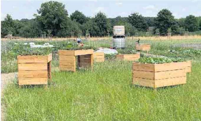
Generationengarten mit Streuobstwiese

Zuerst war es nur eine Idee, nun wird im Generationengarten am Ortsrand von Schaephuysen gehackt, gepflanzt, gegossen und Unkraut herausgerissen: Mit Hilfe von Sponsoren und Helfern konnte die Idee des Vereins umgesetzt werden. Im Frühjahr wurde der Generationengarten des Vereins für Gartenkultur und Hei-