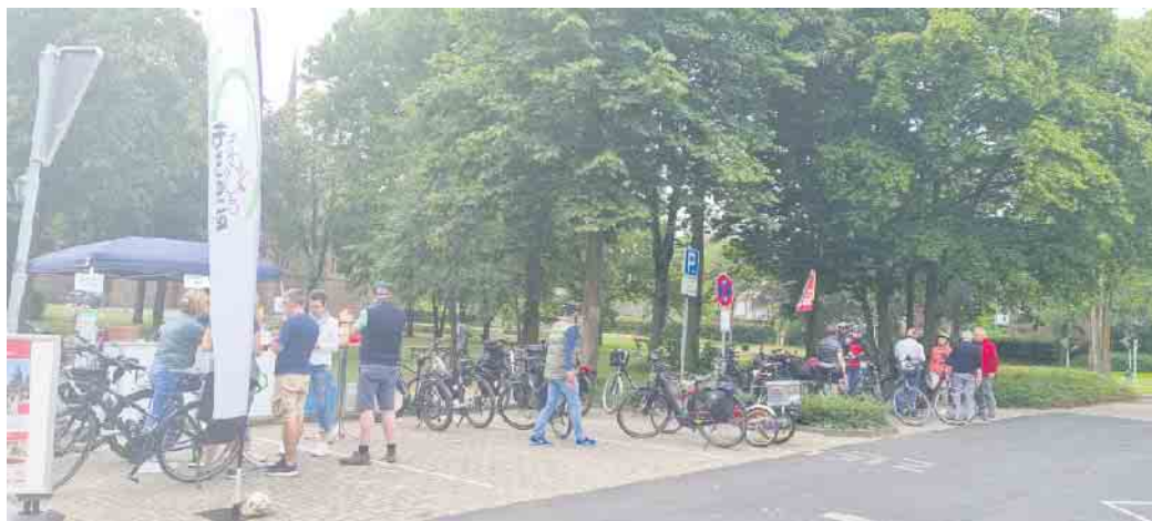
Regel Betrieb an der Stempelstelle am Bürgerpark

Die Strapazen der Radfahrerinnen und Radfahrer werden jedes Jahr durch eine Tombola belohnt. Nach einer gefahrenen Strecke, auf der mindestens zwei Durchgangsstationen anzufahren sind, waren die Teilnehmer berechtigt an einer zentralen Tombola teilzunehmen. Die Preisverleihung für die Ge-