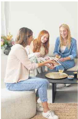
Die Aufgabe einer Schmuckstylistin ist es, eine aktuelle Kollektion vorzuführen und ihre Kundinnen gut zu beraten.

Wichtig ist, dass man einem zukünftigen Auftraggeber niemals selbst Geld zahlt, um für ihn arbeiten zu dürfen. Seriöse Unternehmen statten ihre Stylistinnen mit allem aus, was sie für die Ausführung ihres Jobs benötigen. Zudem sollte er eine gründliche Einarbeitung garantieren. (DJD)