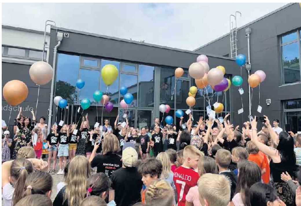
Die Ballons mit den Wünschen für die Zukunft steigen in den Himmel