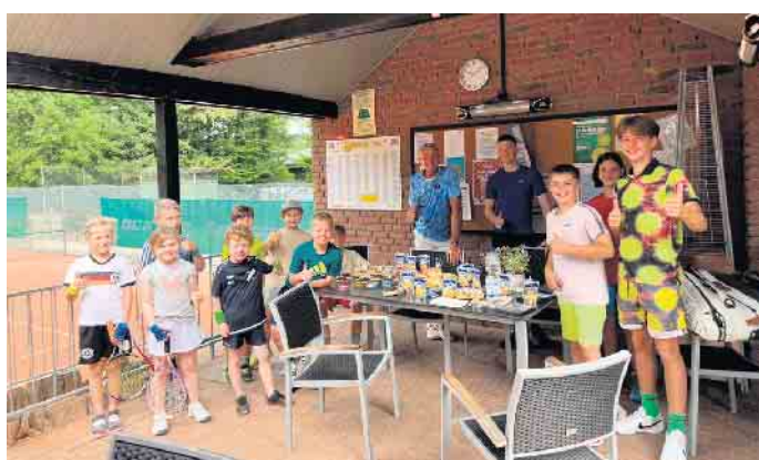
Das gemeinsame Frühstück