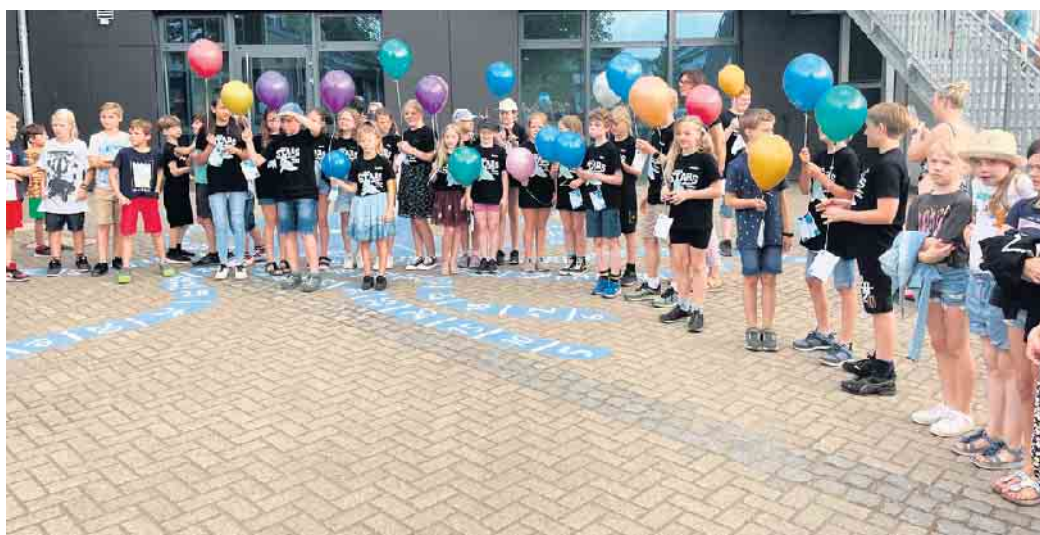
Ein letztes Mal gemeinsam das Schullied singen

Der Förderverein der Martinusgrundschule Rheurdt