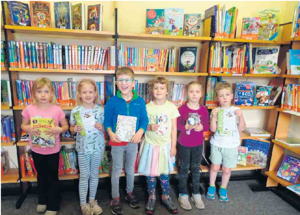
Pfarrgemeinde St. Martinus

Zum Abschluss der Aktion wurde jedem Kind durch den „Bibliotheksführerschein“ bestätigt, dass es die Bücherei kennengelernt hat und sie selbstständig nutzen kann. Mitnehmen konnten sie zusätzlich ein „Katzenhuhn-Abenteuerglas“, in dem Erinnerungen an Leseabenteuer auf-