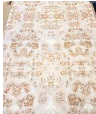
Richtig zusammengefügt könnte man manches Furnierblatt als individuelles und nachhaltiges Kunstobjekt an die Wand hängen.

Sind die Furnierblätter gefügt, werden sie verklebt und fein geschliffen. „Anschließend folgt die Oberflächenbehandlung - zum Beispiel mittels Beizen, Ölen, Wachsen oder durch den Einsatz von Lacken und Lasuren. Dadurch wird die natürliche