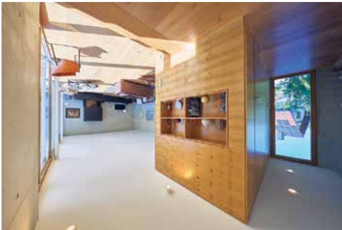
Hier entfaltet das Furnier der Asteiche seine außergewöhnliche Wirkung.

Wie faszinierende Furnierbilder entstehen