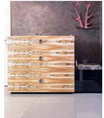
Ein Meisterwerk der Natur: Diese Kommode zeigt auf perfekte Weise, was alles mit Furnier möglich ist.

Maserung noch stärker hervorgehoben“, erläutert Klaas. Und er fasst zusammen: „Furnier ist nach seiner Verarbeitung so schön und einzigartig, dass man beinahe versucht ist, es wie ein Kunstwerk hinter Glas an die Wand zu hängen. Gleichzeitig