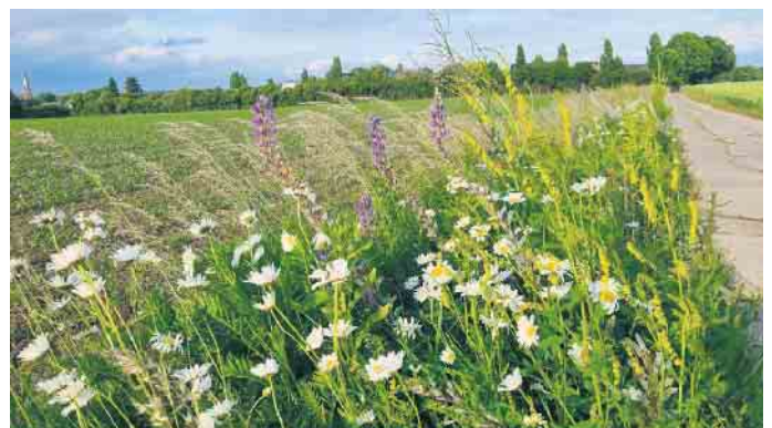
Artenvielfalt im Feldrain oberhalb Schaephuysen