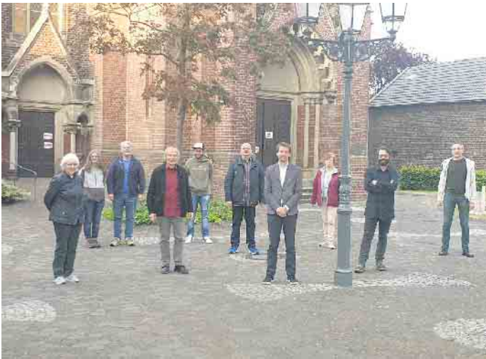
Kandidaten der letzten Wahl