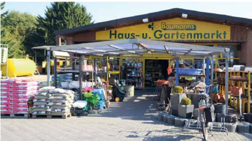
Eingang zum Haus- und Gartenmarkt (2013)

An der Stelle des bisherigen Haus- und Gartenmarktes und des Baumaterialienlagers entsteht nun in nächster Zeit ein Seniorenheim der Caritas.