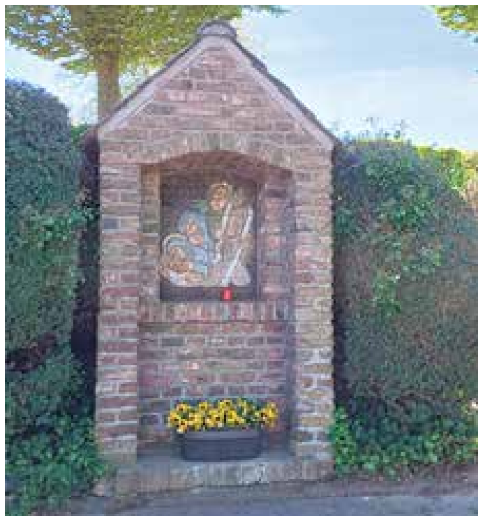
Fußfallstation in Tönisberg