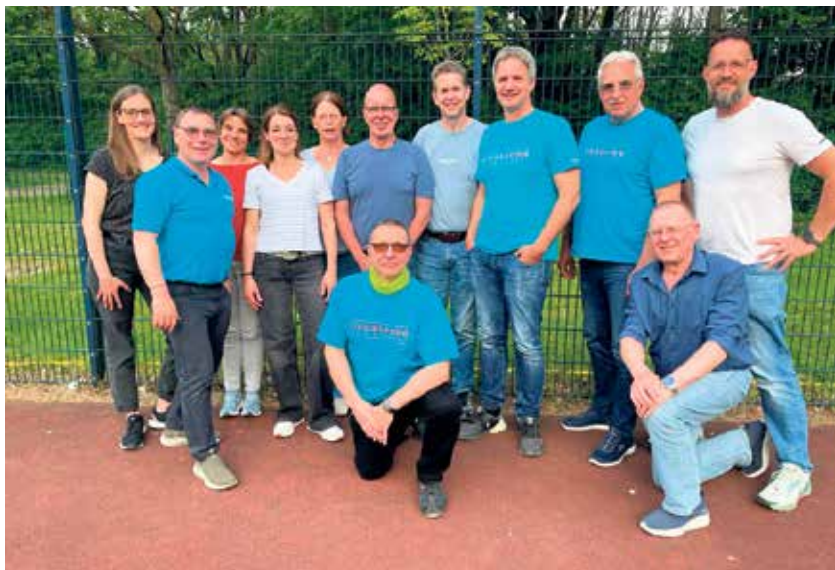
Das Team aus Rheurdt

damit das insgesamt erfolgreiche Abschneiden der Ortsgruppe ab. Hinter diesen Erfolgen steht harte