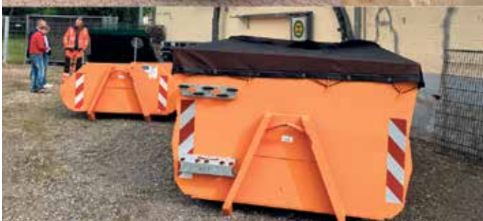
Fuso Canter.