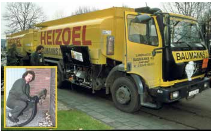
Klaus Dieter Böhm beim Ausliefern von Heizöl in Rheurdt (ca. 1989).

Aus Anlass des Abrisses der Gebäude des ehemaligen Landhandels bzw. des Haus- und Gartenmarktes in Rheurdt, zwischen Rathausstraße 14 und Rathausstraße 16, lesen Sie hier einen kurzen Abriss der Geschichte des Landhandel Baumanns