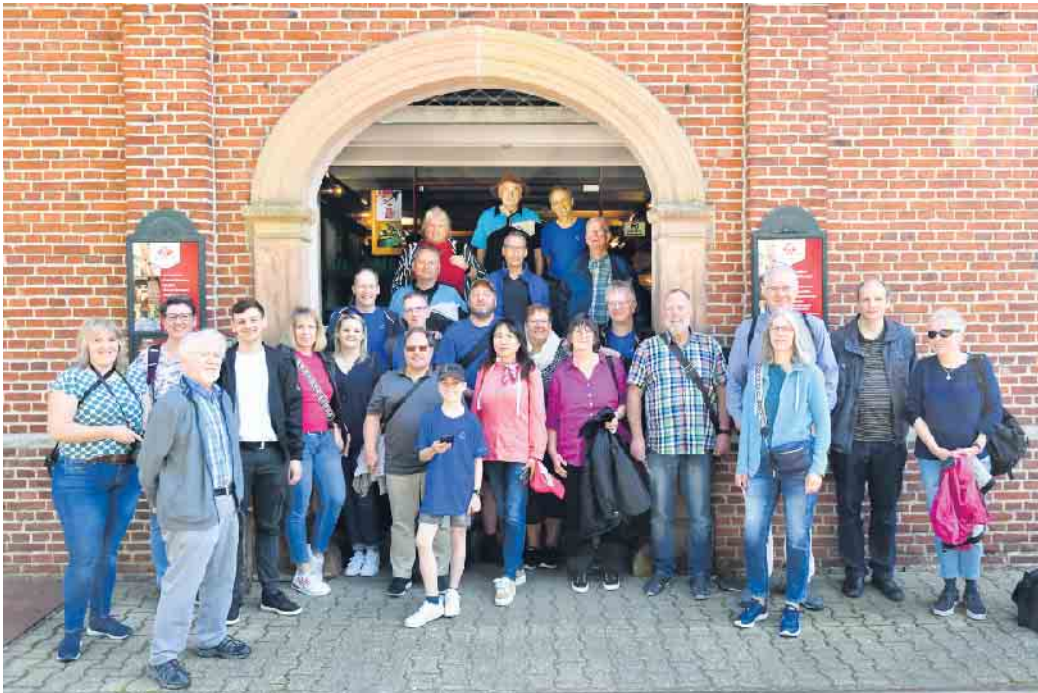
Auf dem Weg nach Papenburg machten die Schaephuysener einen Zwischenstopp bei Berentzen.

Am zweiten Maiwochenende starteten 27 Mitglieder und Freunde des TTC Schaephuysen zu einem zweitägigen Ausflug zur Meyerwerft nach Papenburg. Erster Zwischenstopp auf dem Weg nach Niedersachsen war der Berentzen Hof in Haselünne. Viel Interessantes über die Geschichte der Firma Berentzen und die Herstellung der alkoholischen und alkoholfreien Getränke erfuhren die Schaephuysener. Und eine Verkostung durfte natürlich auch nicht fehlen. Ein Party-Spiel-Programm mit kurzweiligen Spielen sorgte ebenfalls für tolle Stimmung. Frisch und ausgeruht startete die gutgelaunte Truppe dann am nächsten Morgen zur Besichtigung der Meyerwerft. Los ging es mit einer Panoramatour im Bus über das Werftgelände, vorbei am weltgrößten, über 500 Meter langen Trockendock. Anschließend erfuhren die Schaephuysener, wie in der Werft mehrere Kreuzfahrtriesen gleichzeitig entstehen, und wie die gigantischen Schiffe über die Ems schließlich zur Nordsee kommen.