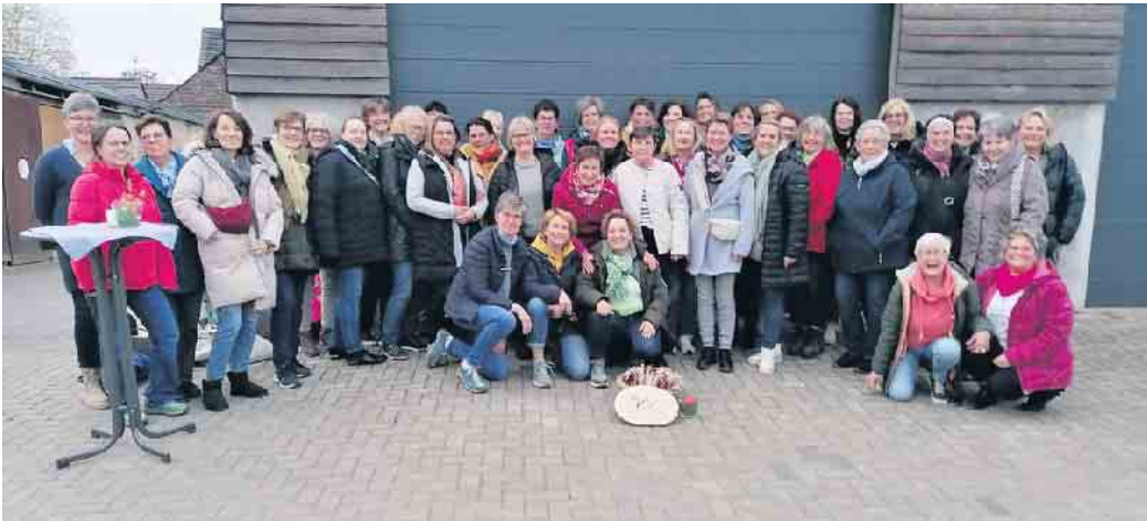
Die Wankumer und Schaephuysener Landfrauen