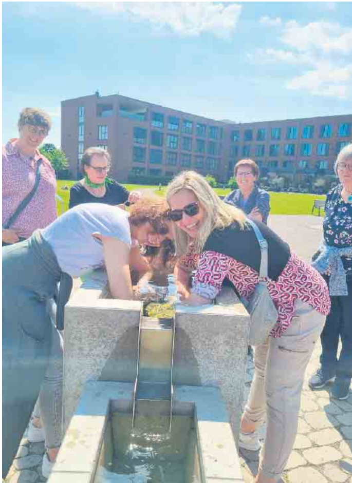
Kneippen ist wie Kaffee trinken