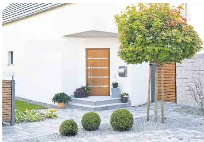
Natürlich anmutende Tür in modernem Design.