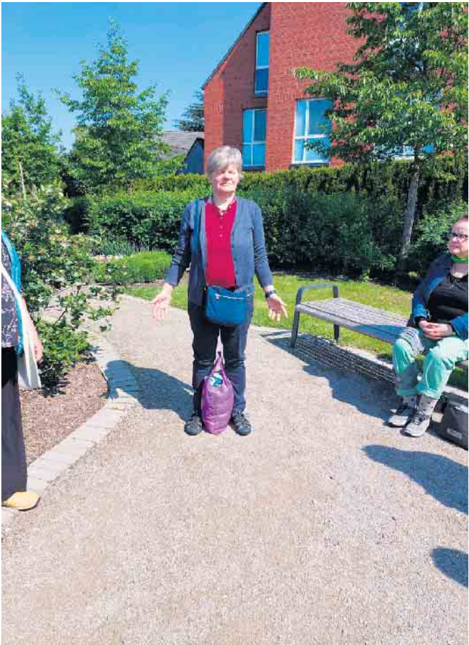
4711 in praktischer Anwendung

Derartig mit Gesundheitspower gestärkt war es Zeit, in der Kevelaerer Innenstadt ein Eis zu essen, zur Kapelle zu gehen und dann mit guten Eindrücken nach Hause zurück zu kehren.