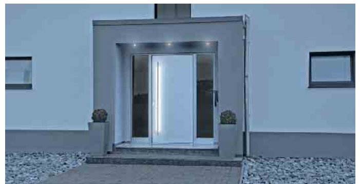
Haustür mit raffinierter LED-Beleuchtung.

Weitere Informationen unter fenster-können-mehr.de (VFF)