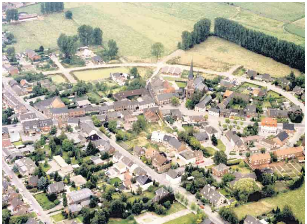
Luftaufnahme von Schaephuysen von August 1992

Direkt im Anschluss können Sie sich zeigen lassen, wie man alte Fotos (Papierabzüge, Dias oder auch Negative) scannt und dann am PC restauriert und einen alterungsbedingten Farbstich entfernen kann. Gerne werden auch Fragen zur Archivierung und zum schnellen Wiederfinden von eigen-