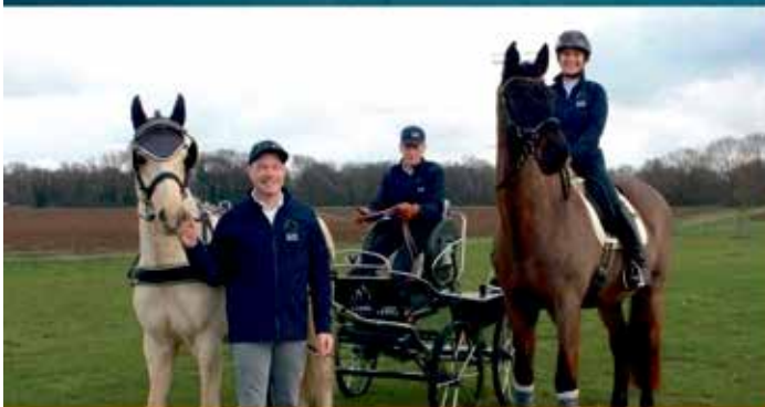
Reit- & Fahrverein Rheurd 1892 e.V.