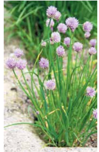
Der Schnittlauch aus dem eigenen Garten ist Schmuck ... und leckere Salatbeigabe.

Ob im reinen Ziergarten oder auch im Nutzgarten mit Gewächshaus: Der Garten ist jetzt jeden Tag mehr ein Ort voller Möglichkeiten. Wer sich direkt an die Realisierung seiner Wünsche machen möchte, findet auf https://www.mein-traumgarten.de/ eine Liste mit Fachbetrieben des Garten- und Landschaftsbaus in der Nähe. BGL