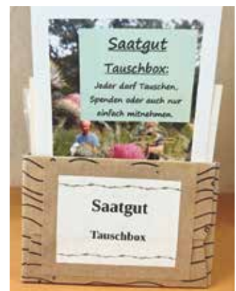
Kath. Pfarrgemeinde St. Martinus, Bücherei Schaephuysen