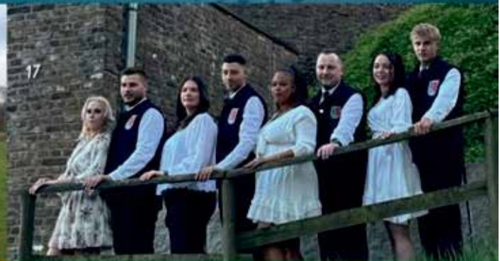
St. Nikolaus Bruderschaft Rheurd