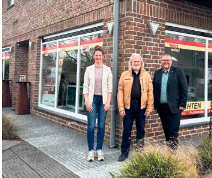
„Wirtschaftsförderung on Tour“ bei THEISMöbel