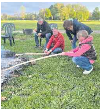
Stockbrot am Osterfeuer an der Kirchstraße

Die Herde mit ihren „Schulklassen“ zu sehen, die Stuten und bereits viele neue Fohlen konnten in unmittelbarer Nähe erlebt werden. In der Zeit von Mitte April bis ca. Mitte Mai ist auch ein Hengst mit in der Gruppe, um für den Nachwuchs im kommenden