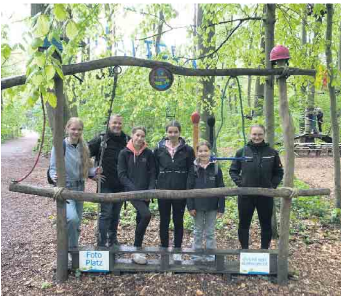
Jugend im Kletterpark

Verein oder Verband oder der Gruppe von Freiwilligendienstleistenden anreisen. Sie haben durch vielfältige thematische Angebote die Möglichkeit, gemeinsam in ihrer Gruppe den Ort, vor allem aber auch die eigenen Fähigkeiten zu entdecken. Freiwilligendienstleistende tragen mit Hilfe eines vielseitigen Teams dazu bei, dass der St. Michaelturm ein Ort ist, an dem sich Gäste wohlfühlen, sowie sich selbst ausprobieren und erleben können. Grundvoraussetzung für den Bundesfreiwilligendienst am St. Michaelturm ist die Motivation, mit verschiedenen Menschen in Kontakt zu kommen und sich einbringen zu wollen. Freiwilligendienstleistende müssen zu Dienstbeginn im August mindestens 16 Jahre alt sein und die allgemeine Schulpflicht absolviert haben. Der St. Michaelturm bietet ein monatliches Taschengeld und Einblick in gleich mehrere Arbeitsfelder. Ergänzt wird der Freiwilligendienst durch Bildungstage in Seminarwochen. Kontakt kann unkompliziert per E-Mail über paedagogik@michaelturm.de aufgenommen werden.