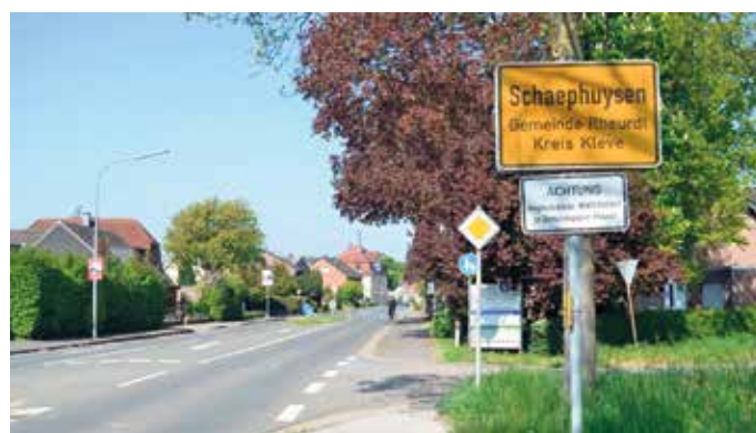
Ortseingang Vluyner Straße