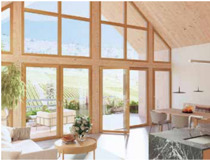
Bei großen Fensterfronten ist der Energiespar-Effekt von gut gedämmten Fenstern besonders groß.

Steigende Energiepreise bereiten vielen Haushalten Sorgen. Wer seine Heizkosten dauerhaft senken möchte, kann mit modernen Fenstern viel erreichen. Der Verband Fenster + Fassade erklärt, wann sich ein Fenstertausch lohnt, und welchen Effekt neue Fenster für Wohnkomfort und Sicherheit haben. Heizen mit fossilen Energieträgern oder Strom werden für viele Haushalte immer teurer und ein Ende der Preisspirale ist nicht in Sicht. Wegen der schrittweisen Anhebung des CO 2 -Preises werden die Energiepreise in den nächsten Jahren absehbar weiter steigen. Wer langfristig sparen möchte, sollte jetzt seinen Energieverbrauch reduzieren - auch als Beitrag zum Klimaschutz. Hier steckt großes Potenzial in den eigenen vier Wänden: Eine energetische Sanierung reduziert den Heizenergiebedarf deutlich und senkt dauerhaft auf Jahre die Heizkosten und spart damit bares Geld. Besonders wirksam ist dabei die Sanierung der Gebäudehülle: Fenster, Fassade und das Dach. Denn je weniger Wärme über die Hülle entweicht, desto weniger muss geheizt werden. Erster Ansatzpunkt sind dabei die Fenster. In einem ersten Sanierungsansatz können diese als Einzelmaßnahme vorab getauscht werden.