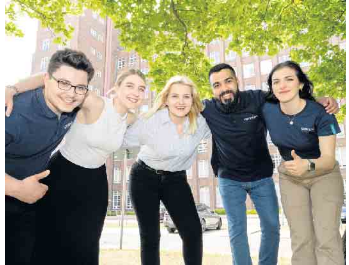
Junge Karrierestarter sollten ihr späteres Betätigungsfeld nach persönlichen Neigungen wählen.