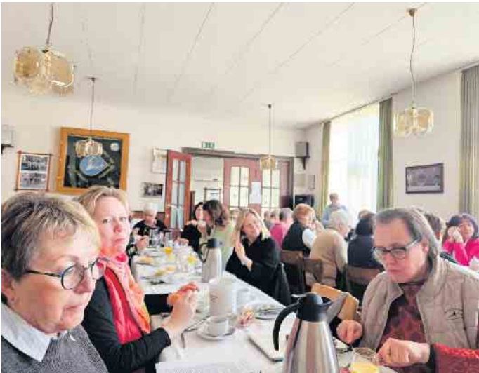
Das Essen schmeckt.