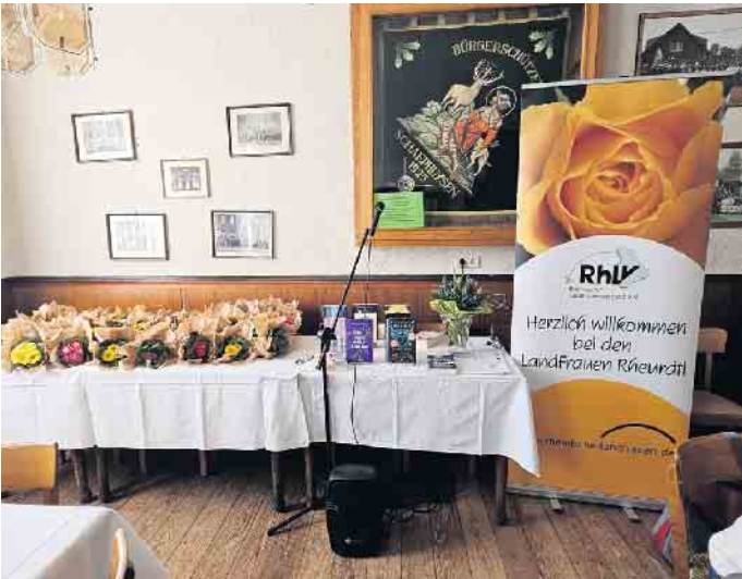
Es ist alles vorbereitet.