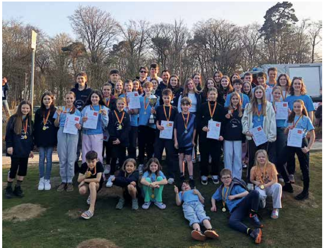
Gruppenbild am Tag der Mannschaftsmeisterschaften

An beiden Wettkampftagen konnte unsere Ortsgruppe zahlreiche Podestplätze und mehrere Siege erzielen. Der größte Erfolg: Sowohl bei den Einzel- als auch bei den Mannschaftsmeisterschaften haben sich unsere Starter den Gesamtsieg in der Gesamtwertung aller teilnehmenden Ortsgruppen erschwimmen können! Neben den sportlichen Erfolgen