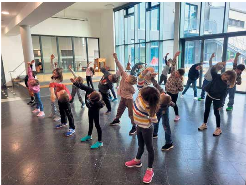
Tanzübungen in der Aula

Eine Woche lang wurde täglich eine Stunde intensiv geübt. Mit viel Mo-