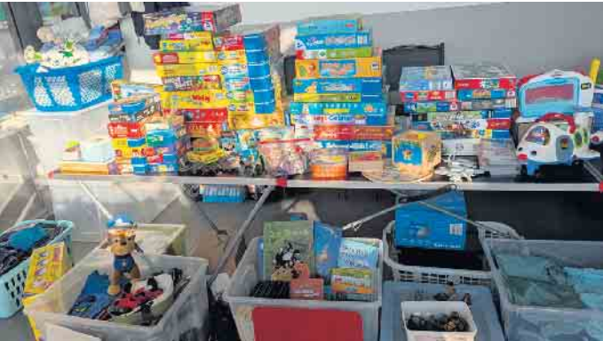
Viele Stände luden zum Stöbern ein.

Vielen Dank. Datum: Mo., 28. April Uhrzeit: 17.30 bis 19 Uhr Ort: Rheurdt, Kirchstr. 8 Pfarrheim Gebühr: 7 Euro Leitung: Liss Steeger