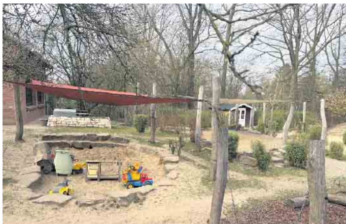
Vielleicht wird das Außengelände auch so schön wie das des AWO Kindergartens in Rheurdt