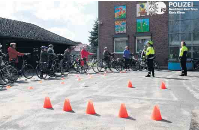
Pedelec-Training der KPB Kleve