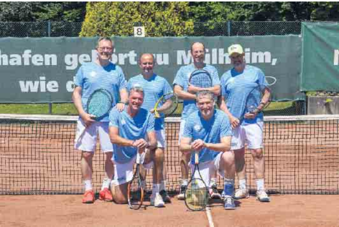
Niederrhein Derby am 3. Mai um 14 Uhr mit den Herren 50.