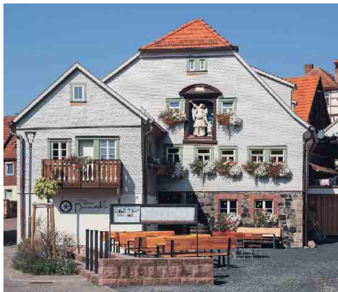
Wer die alte Mühle kannte, kommt aus dem Staunen nicht heraus.

Nicht sachgemäße Umbaumaßnahmen in der Vergangenheit und das undicht gewordene Dach hatten erhebliche Bauschäden am jahrhunderte alten Gebäude einer Müllerfamilie verursacht. Der Dachstuhl musste erneuert und das Gebäude komplett entkernt werden. Immerhin gelang es, das Originalfachwerk, Bemalungen und Teile des alten Holzfußbodens zu retten. Die alten Putzstrukturen der Mühle sollten übernommen werden, und da war es ein Glück, dass ein älterer Geselle der ausführenden Firma diese Technik, die er in der Jugend gelernt hatte, noch beherrschte. Alte Schindeln aus Eichenholz mussten zum Teil ausgetauscht, die verbliebenen mit einem Trockeneisverfahren