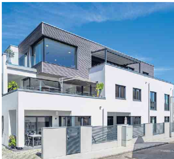
Mehrgenerationenhäuser in Holz-Fertigbauweise sind im Kommen.

In vielen Regionen Deutschlands sind Baugrundstücke aufgrund großer Nachfrage und teils mangelhafter Baulandausweisung schwer zu finden. Hinzu kommt, dass Baugrund ebenso wie Bauen insgesamt in den letzten Jah-