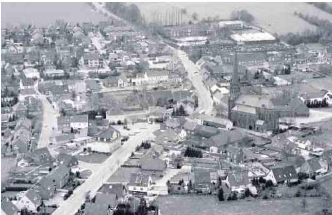
Schaephuysen zum Zeitpunkt des Erdstoßes im Jahre 1984

auf der Richterskala bis 9. Das hört sich nicht viel an - ist es eigentlich auch nicht - jedoch, wenn man noch nie einen Erdstoß erlebt hat, dann macht einem auch ein solcher relativ leichter Erdstoß erhebliche Angst. Grund war jedoch kein tektonisches Erdbeben, sondern es waren bergbauliche Einwirkungen (sog. Entspannungsschläge), die zu den Erschütterungen in Schaephuysen führten. Ernste Schäden gab es zum Glück keine.