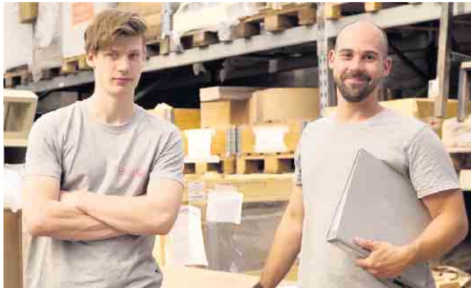
Viele Nachwuchskräfte kommen über ein Praktikum zu ihrem Beruf als Ofen- und Luftheizungsbauer.

Für die Ausbildung ist ein bestimmter Schulabschluss nicht vorgeschrieben. Einige beginnen mit einem Haupt-, Mittel- oder Realschulabschluss, andere steigen nach dem Abi ein. Die Ausbildung dauert in der Regel drei Jahre im dualen System, pro Halbjahr stehen sechs Wochen Berufsschule und eine Woche überbetriebliche Ausbildung auf dem Programm. Eine Verkürzung der Ausbildung ist möglich. Nach der Gesellenprüfung stehen viele Türen offen: Ofen- und Luftheizungsbauer arbeiten sowohl für Industriebetriebe, die Öfen in Serie herstellen, als auch in Kleinbetrie-