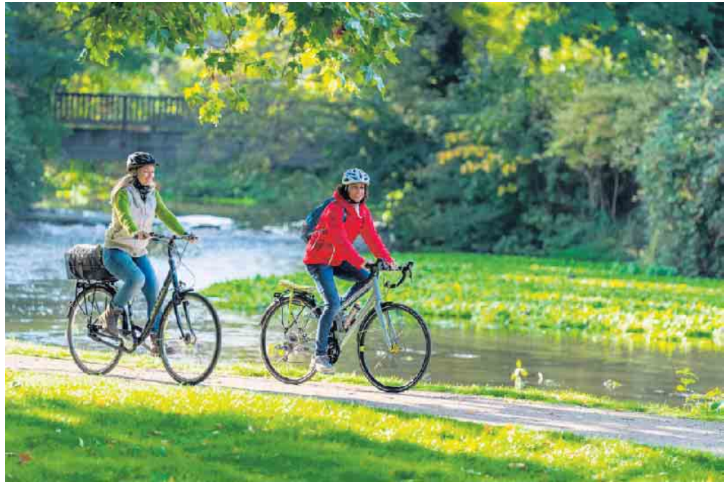
Natur pur erleben: Der neue Raderlebnistag spricht Rad-Fans aller Altersgruppen an.