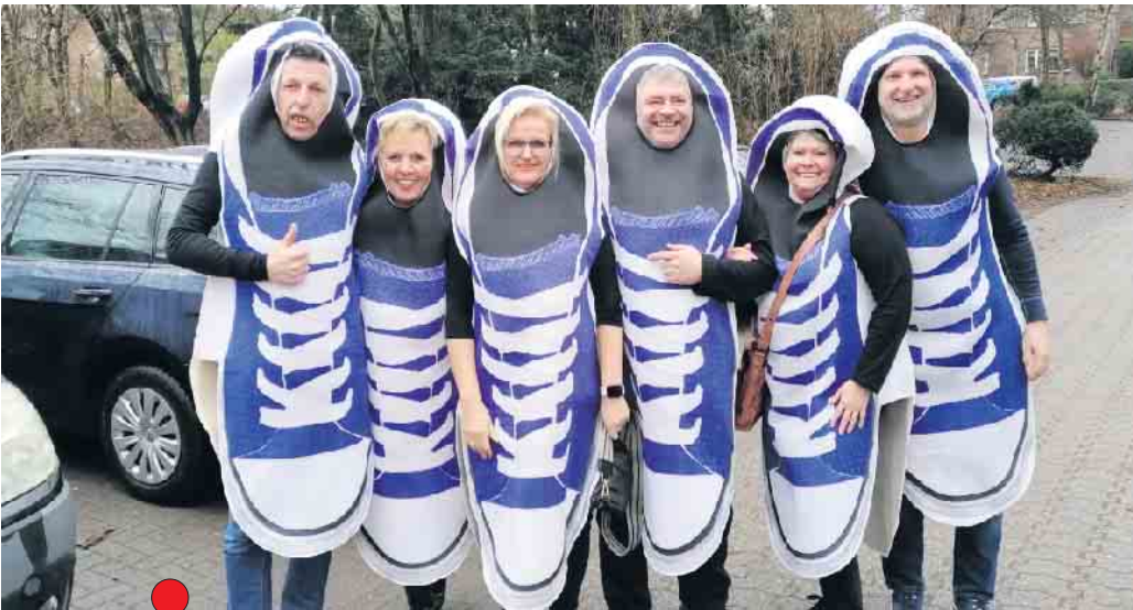
Kleine Karnevalsfeier in der TP Rheurdt