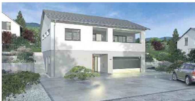
Ein Wohnkeller ist ein sicheres und komfortables Fundament für einen effizienten Hausbau am Hang.