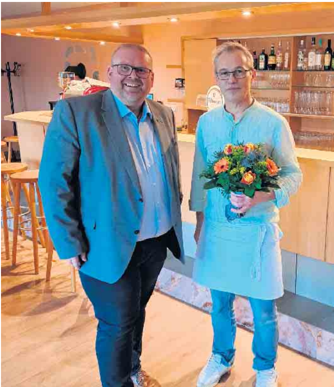
Begrüßung der Pizzeria Lido in der Gemeinde Rheurdt

Die nächste Bürgersprechstunde findet am Donnerstag, den