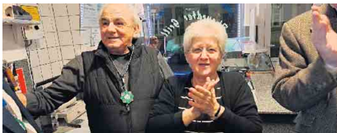
Das Betreiber-Ehepaar des Rheurdter Grills sorgt seit vielen Jahren für das leibliche Wohl des HFS und wurde verdienterweise in diesem Jahr mit einem Orden ausgestattet.