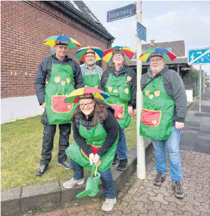
Der Tulpenweg geht zum Nelkenzug: Helau