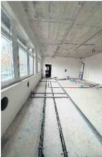
Ansicht eines neuen Klassenraums

Um den stetig steigenden Anmeldezahlen gerecht zu werden, wird die Martinusschule in Rheurdt noch in diesem Jahr erweitert. Der Anbau ist notwendig geworden, da die Schülerzahlen kontinuierlich steigen und die Schule mittlerweile regelmäßig dreizügig ist. Auf dem Gelände der ehemaligen Lehrerparkplätze sind die Baumaßnahmen schon in vollem Gange und sollen bis April 2025 - pünktlich zu den Osterferien - abgeschlossen sein.