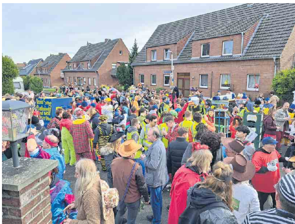
Straßenkarneval 2025

Die ortsansässigen Gaststätten „Zur Post“ und „Zur Mühle“ öffnen unmittelbar nach dem Zug aber auch bereits ihre Pforten für die