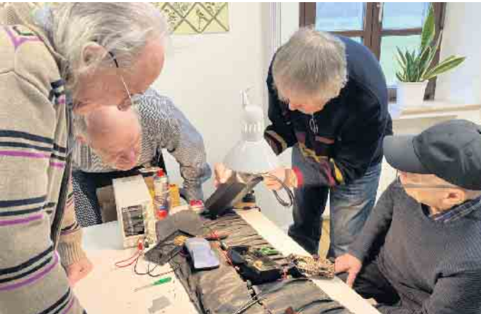
ReparaturCafé.

vorzeitig zu entsorgen und neu zu kaufen. Das Förderprogramm ist die erste Bundesförderung dieser Art. In der ersten Förderrunde stellt das BMUV mehr als drei Millionen Euro Fördermittel für gemeinnützige Vereine zur Verfügung. Im weiteren Verlauf sollen auch Einrichtungen gefördert werden, die nicht als Verein konstituiert sind. Bundesumweltministerin Steffi Lemke: „Mit dem Förderprogramm „Reparieren statt Wegwerfen“ wollen wir die Lebensdauer von Produkten verlängern, um Ressourcen zu sparen. Wenn Verbraucherinnen und Verbraucher ihre Elektrogeräte oder andere Produkte reparieren, dann können sie diese länger nutzen und müssen erst dann ein neues Produkt kaufen, wenn es wirklich nötig ist. Repair-Cafés und Selbst-