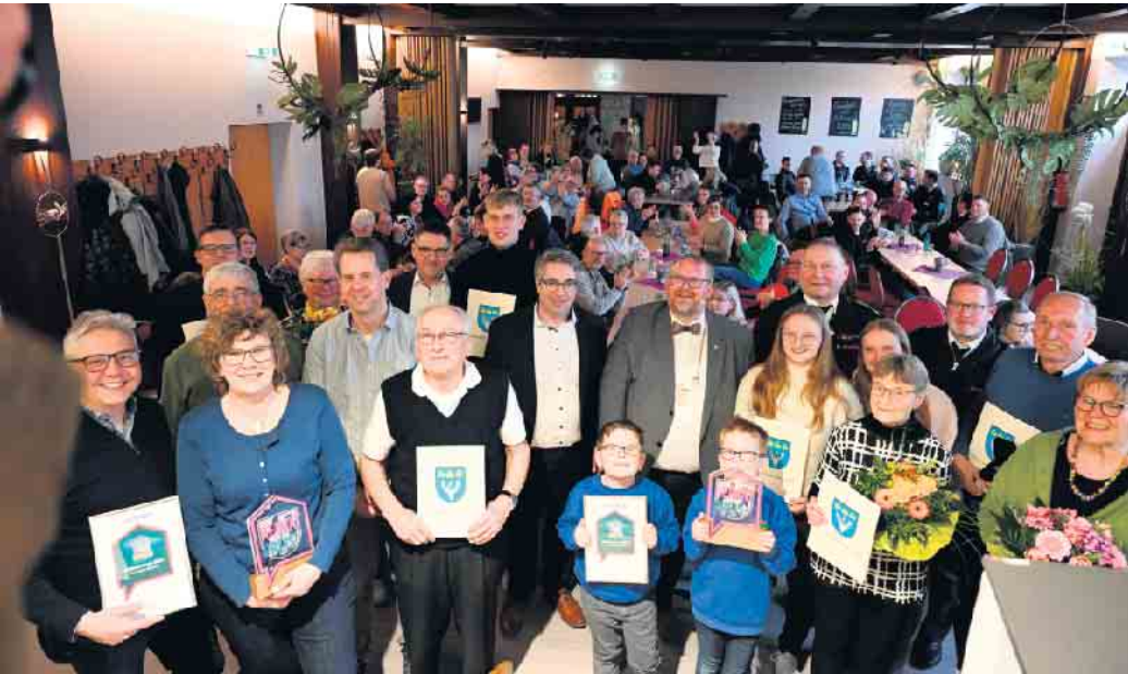
Die Preisträgerinnen und Preisträger auf dem Neujahrsempfang 2025