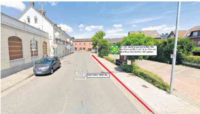
Neue Haltestelle (Nur Linie 077) Höhe Gaststätte Hauser