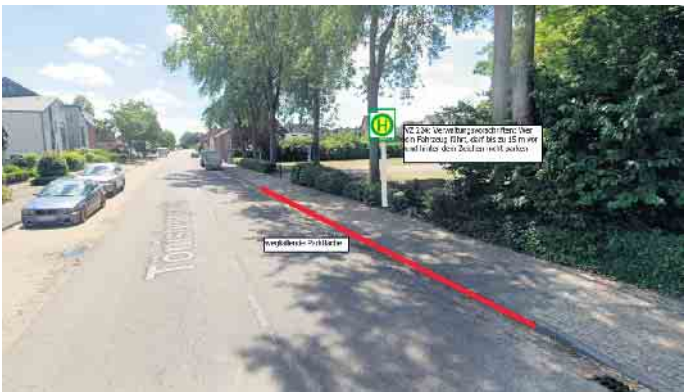
Neue Haltestelle (Nur Linie 077) Marktplatz/Kirmesplatz Schaephuysen

Die auf der Grünstraße (von der Tönisberger Straße kommenden) eingerichteten Haltverbote (mittels Markierungen) entfallen und somit sind die 3 Parkflächen, die auf der Tönisberger Straße durch die Einrichtung der Haltestelle wegfallen in unmittelbarer Nähe kompensiert.