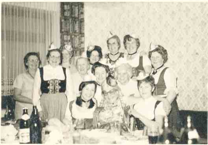
Karneval im Hause Wessel

geben. Da so ein Artikel auch sehr von persönlichen Geschichten usw. lebt, können sich ehemalige Schülerinnen und Schüler gerne an das Gemeindearchiv ( steffen.geiling@rheurdt.de ) wenden und vielleicht das eine oder andere aus der Schulzeit in der Hauptschule Rheurdt berichten.