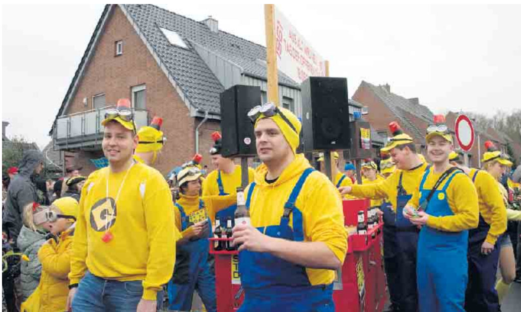
Zugverlauf im Innenteil