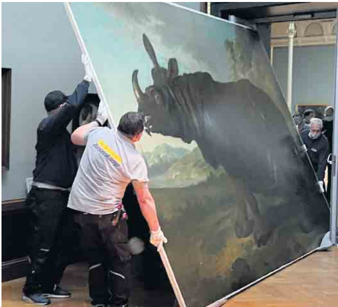
Das Gemälde von Nashorn Clara hängt üblicherweise im Staatlichen Museum Schwerin. Da das Haus wegen Renovierungsarbeiten für drei Jahre geschlossen ist, ging Clara mit großem Aufwand auf Reisen - unter anderem ins berühmte Rijksmuseum nach Amsterdam.