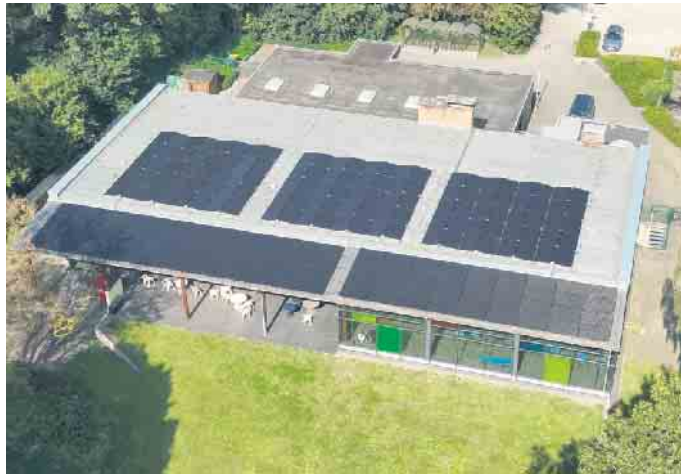
Photovoltaik auf dem Hallenbaddach