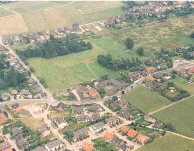
Der Heideweg auf einer Luftaufnahme von August 1992

Auf der heutigen Luftaufnahme sind die Häuser Heideweg 77 bis 83 zu sehen. Aus einer Aufstellung der Häuser und Wohnungen in Rheurdt aus dem Jahre 1961 ist ersichtlich, dass zu dieser Zeit der Heideweg mit 25 Häusern bebaut war und sich darin 26 Wohnungen befanden. Aus der gleichen Aufstellung (1961)