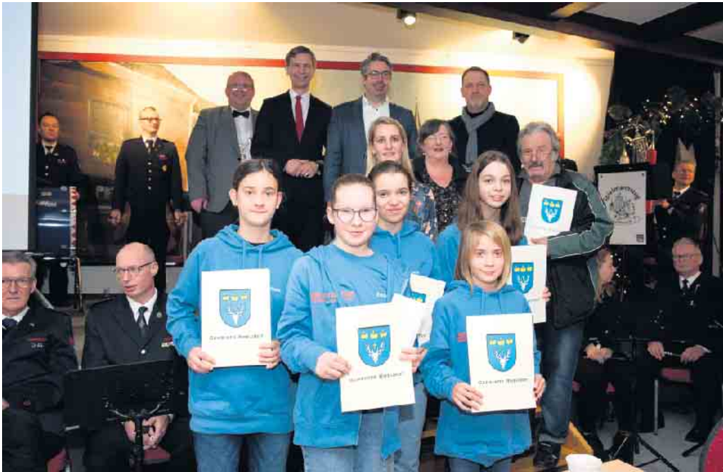
Die Preisträgerinnen und Preisträger der Sportlerehrung 2024