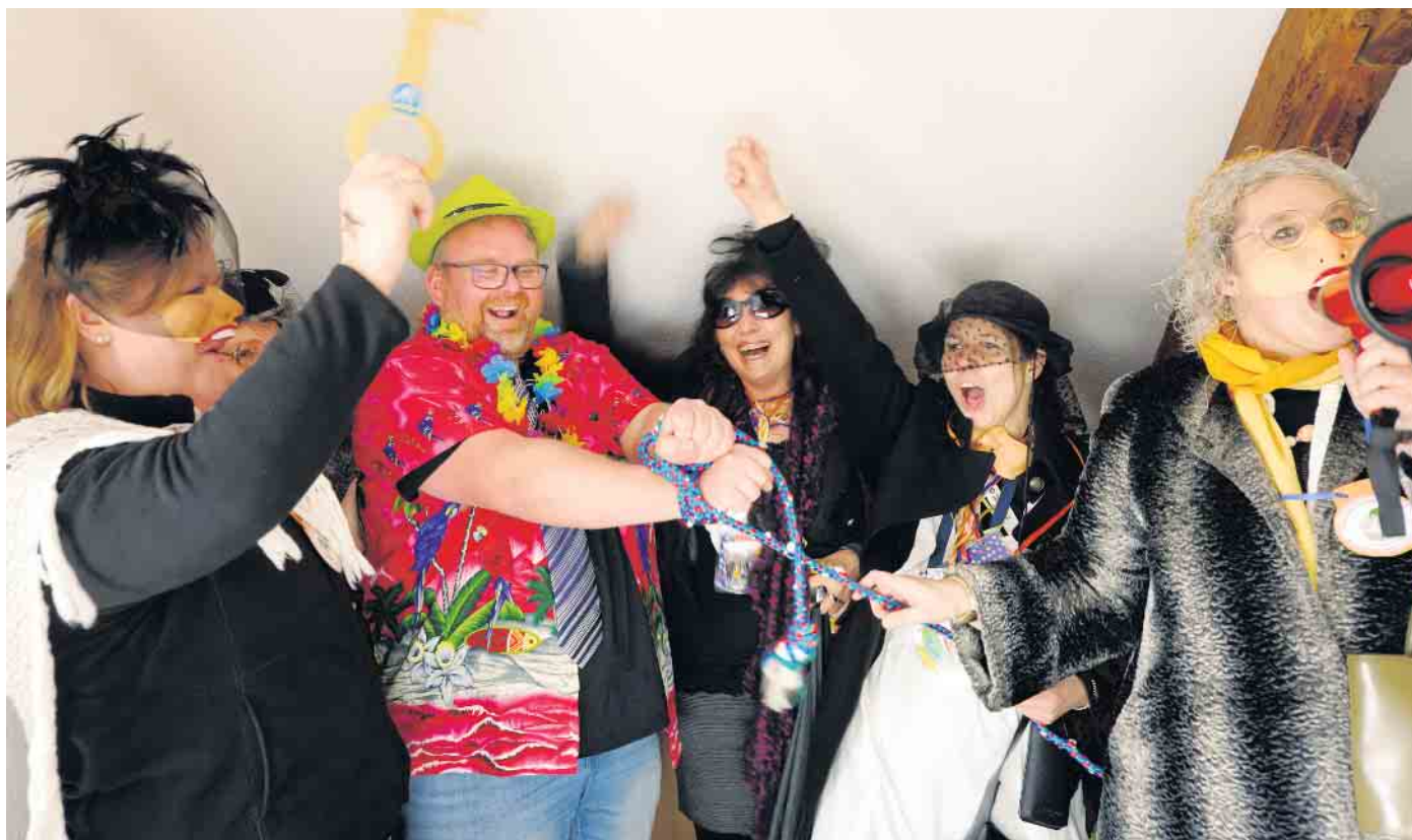
Altweiber mit den Rheurder Möhnen 2024 erstmals im Haus Quademechels.