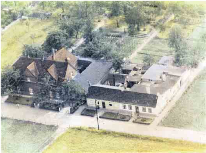
Die Häuser Heideweg 77 bis Heideweg 83 auf einer Luftaufnahme von 1944.

ist zu entnehmen, dass in den abgebildeten Häusern folgende Familien lebten: Heideweg 77: Familie Egger Heideweg 79: Familie Boersma Heideweg 81: Familie Streubel Heideweg 83: Familie Mathias Bongartz Auf dem zweiten Luftbild kann man sehen, dass 1992 hauptsächlich der