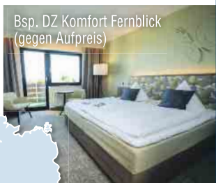
Bsp. DZ Komfort Fernblick (gegen Aufpreis)