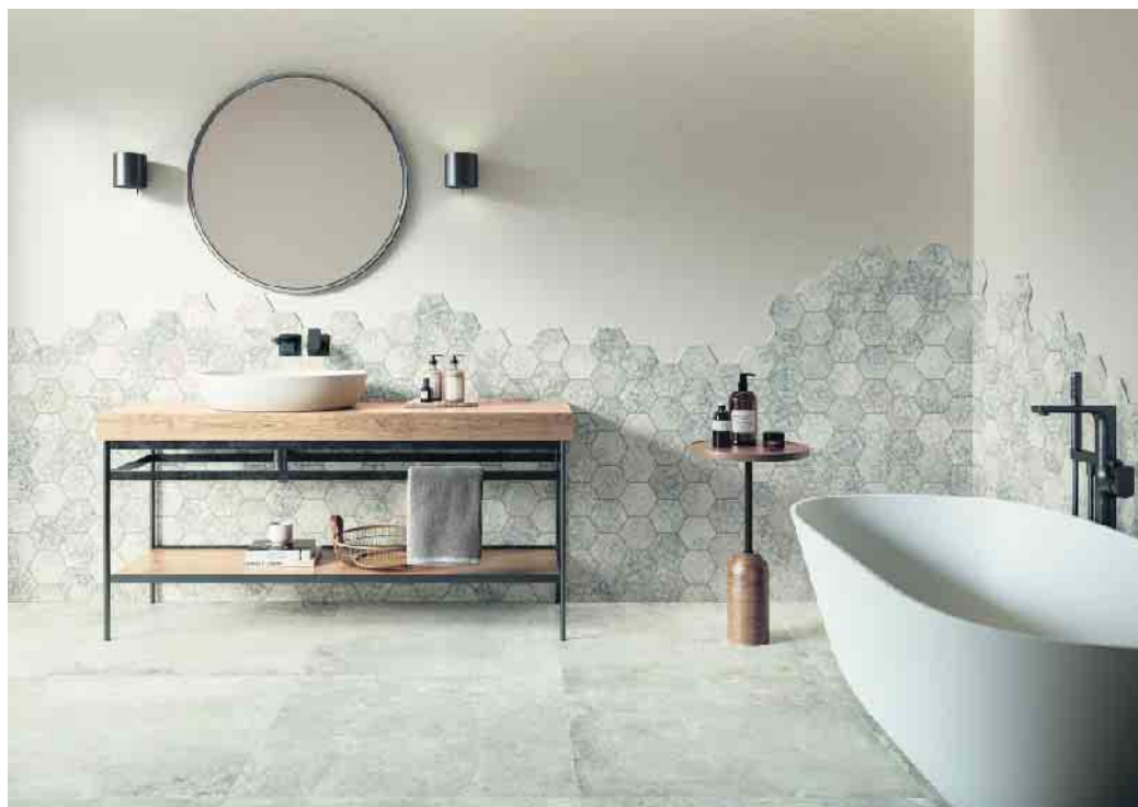
Die Nasszelle von einst entspricht nicht mehr unserem Lebensgefühl. Das Bad hat sich zu einem sinnlichen Lebensraum gewandelt.