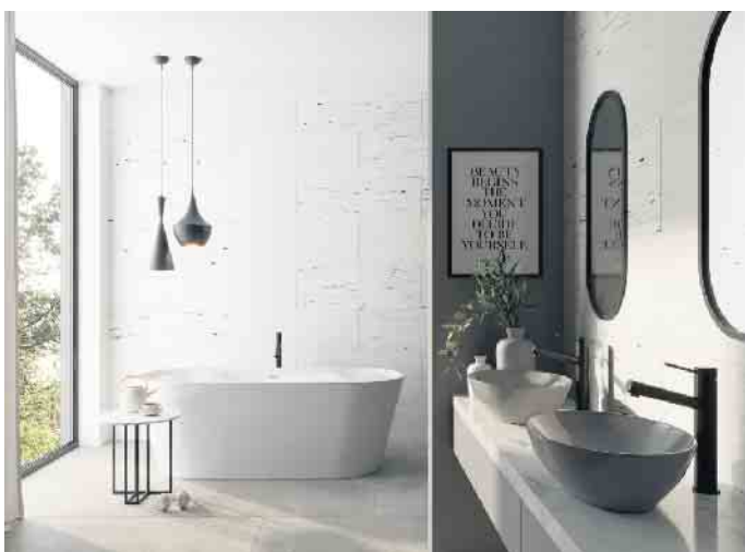
Die Gestaltung und Einrichtung des Bads plant man heute ebenso individuell und persönlich wie Wohnzimmer und Küche.

sich beispielsweise die Wände im Duschbereich fugenlos oder fugenarm gestalten lassen. Fliesen im urbanen Beton- oder Estrichlook unterstreichen architektonisch-minimalistische Einrichtungskonzepte. Wohnlich-gemütlich wirken Fliesen in Holzoptik, die heute mit haptisch ansprechenden, authentischen Maserungen der Oberfläche angeboten werden. So lassen sich die neuen Holzfliesen kaum vom Original unterscheiden. Zugleich sind sie auf Dauer feuchtigkeitsbeständig und rutschhemmend - das ist ideal für die bodenebene Dusche. (djd)