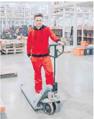
Der Mangel an Fachkräften hat in Deutschland einen neuen Höchststand erreicht.

tungen an den neuen Job klar zu werden. Welche Branche passt am besten? Eine kurze Recherche im Internet, Informationsbroschüren oder Erfahrungsberichte helfen bei der Beantwortung dieser Frage. Ausgeschlossen ist ein Quereinstieg nur in einigen Bereichen: Sogenannte geschützte Berufe wie Physiotherapeuten oder Ingenieure können nach wie vor allein mit abgeschlossener Berufsausbildung ausgeübt werden. (djd)