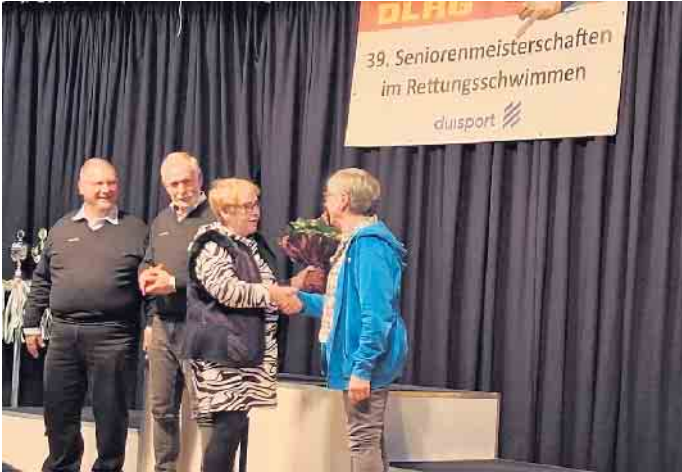
Ehrung der ältesten Schwimmerin