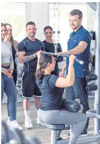
Gut ausgebildete Fachkräfte betreuen Kundinnen und Kunden in Fitness- und Gesundheitsanlagen bei ihrem bedarfsgerechten Training.

Zum Ende des Jahres 2023 konnten die Fitness- und Gesundheitsanlagen in Deutschland 11,3 Millionen Mitglieder verzeichnen. Dieser Wert entspricht einem Zuwachs von über einer Million Mitgliedern im Vergleich zum Vorjahr, wie die „Eckdaten der deutschen Fitnesswirtschaft 2024“ zeigen - eine Datenerhebung des DSSV, der Prüfungs- und Beratungsgesellschaft Deloitte sowie der DHfPG. Schon 2022 hatte es ein Plus von einer Million Mitgliedern gegeben - was allerdings noch zu einem Großteil auf den Nachholeffekt nach der Aufhebung der pandemiebedingten Beschränkungen zurückgeführt werden konnte. 2023 hat sich der Wachstumstrend in gleicher Größenordnung fortgesetzt. (DJD)