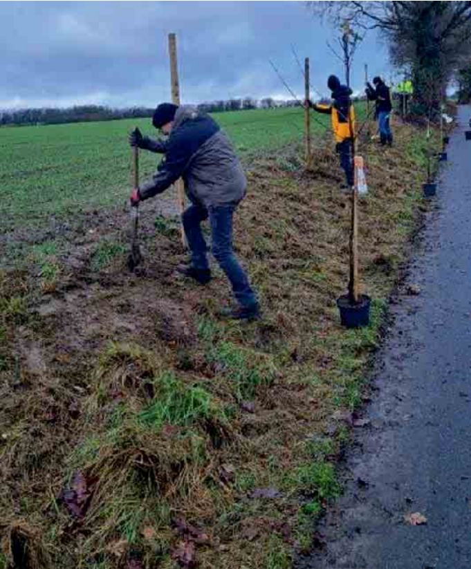
Pflanzteam im Einsatz