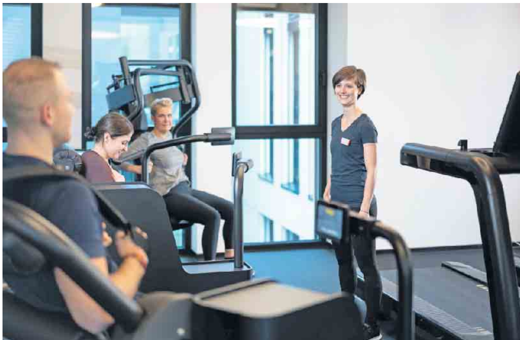
Fitness- und Gesundheitsanlagen etablieren sich zunehmend als elementare Bestandteile der Gesundheitsversorgung. Entsprechend gut muss die Ausbildung der Fachkräfte sein.

Denn den Fachkräften - beispielsweise den Trainerinnen und Trainern - kommt hier eine entscheidende Rolle zu. Sie tragen maßgeblich zum Trainingserfolg bei und motivieren die Mitglieder in Fitness- und Gesundheitsanlagen langfristig. Das gut ausgebildete Fachpersonal muss eine bedarfsgerechte und fundierte Betreuung der Trainierenden sicherstellen können. Qualifizieren können sich künftige Fitness- und Gesundheitsexperten beispielsweise an der staatlich anerkannten Deutschen Hochschule für Prävention und Gesundheitsmanagement (DHfPG). Sie bietet sieben duale Bachelor-Studiengänge, vier Master-Studiengänge, ein Graduiertenprogramm sowie über 100 Hochschulweiterbildungen in den Bereichen Prävention, Gesundheit, Ernährung, Fitness, Sport und Informatik an.