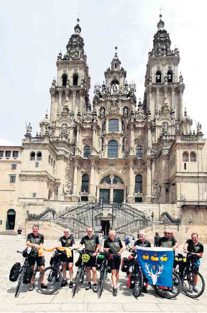
Fahrrad-Pilger vom Niederrhein in Santiago de Compostela

Die Gruppe der Fahrradpilger wird nach dem Vortrag anlässlich des Martinsmarktes in Rheurdt ein weiteres Mal über die Pilgerreise im Juni 2023 nach Santiago de Compostela informieren und zwar am Montag, 29.01.2024, um 18.30 Uhr in der St. Hubertus Kirche in Schaephuysen. In dem etwa einstündigen Vortrag wird mit Informationen und Fotos auf