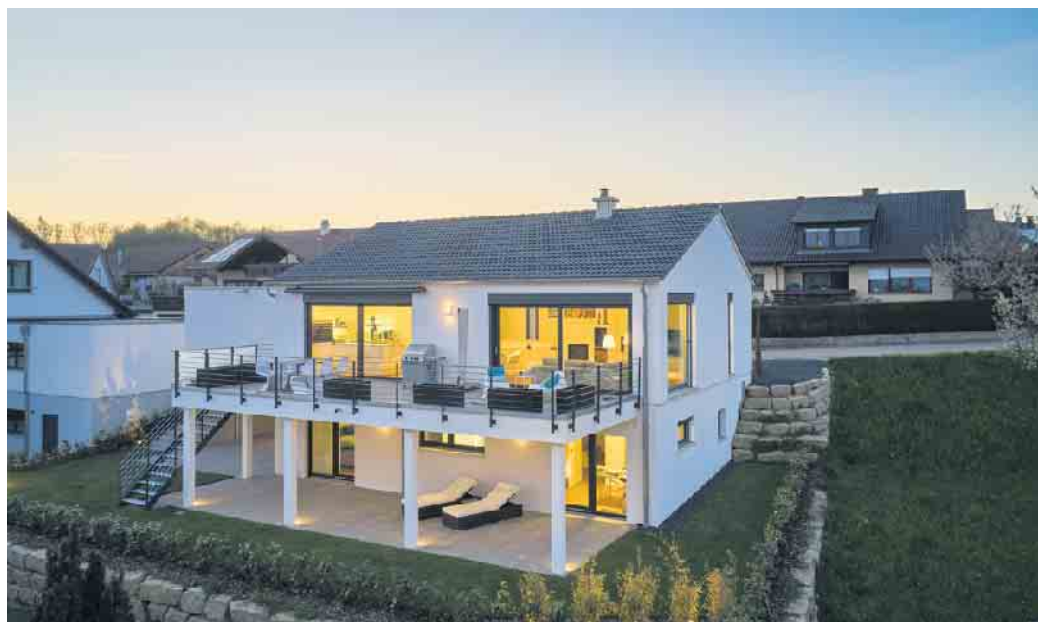
Keller werden heute zum Wohlfühlwohnen genutzt.

Die entstehende Wohnfläche im Untergeschoss des Hauses kann zum Beispiel für eine Wellness-oase oder für ein Homeoffice selbst genutzt oder aber für eine separate Wohneinheit verwendet werden. Eine Einliegerwohnung dient beizeiten etwa dem heranwachsenden Nachwuchs als Starthilfe; oder sie vergrößert durch Mieteinnahmen das Einkommen und die Altersvorsorge; nicht zuletzt bietet sie Flexibilität für das eigene Wohnen im Alter. „Mit separatem Eingang und Terasse sowie einer barrierefreien Wegeführung ausgestattet, eignet sich die Souterrainwohnung ideal für die besten Jahre in den eigenen vier Wänden“, merkt Kunz an. „Die darüberliegende Haupt-Wohneinheit kann