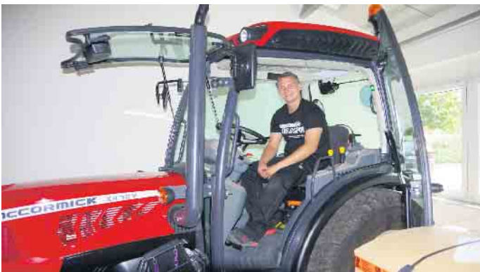
Schweres Gerät sicher beherrschen: Die Leidenschaft für Technik ist eine gute Voraussetzung für eine Ausbildung im Motorgeräte-Fachhandel.