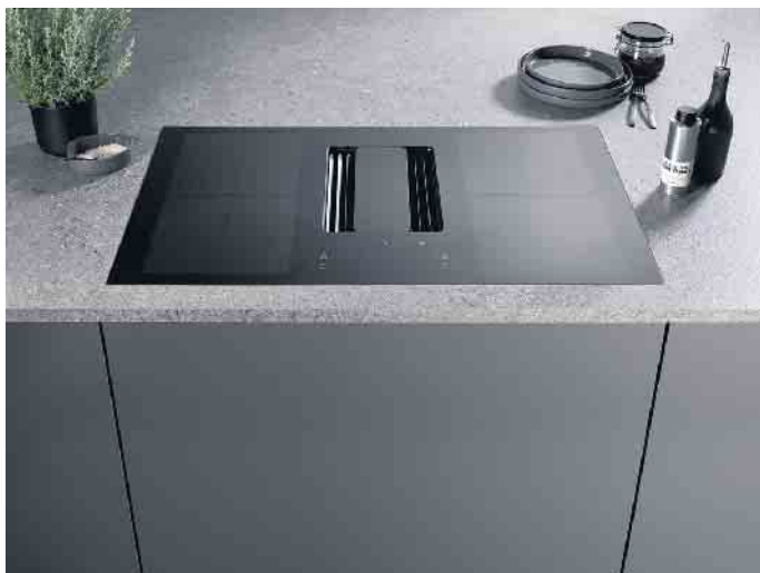
Prämierte, kompakte 2in1-Einheit, z. B. ideal für Kochinseln, ausgestattet mit einem leistungsstarken, energieeffizienten Lüftungskonzept und einem regenerativen Filtersystem. Optional mit schicker Drehknebelsteuerung.

und Dampfschwaden geschützt sind und unangenehme Gerüche aus der Luft entfernt werden. Beispielsweise auch mithilfe optionaler Umluft-Hochleistungsfilter mit ihrer sehr hohen Geruchsreduzierung. Sie halten übrigens auch luftgetragene Pollen zurück und deaktivieren Allergene im Filter, was für alle Allergiker eine besondere Erleichterung ist. Oder wartungsfreie, selbstreinigende Umluftfiltersysteme, die sich z. B. auf der Basis eines thermokatalytischen Verfahrens regenerieren und so für gute Luft sorgen. „Das Schöne an den neuen Lüftungskonzepten ist darüber hinaus, dass für jeden Lifestyle, jedes Haushalts-Budget und jede Raumgröße etwas dabei ist“, sagt AMK-Geschäftsführer Volker Irle. Das kann - je nach persönlichem Einrichtungs- und Lebensstil - ein Hingucker über der Kochinsel in einer offenen Wohnküche sein wie z. B. eine attraktive Insel- oder Deckenhaube mit Liftfunktion. Neben einer effizienten Lüftung und Geruchsbeimischung ziehen sie aufgrund ihrer außergewöhnlichen Optik