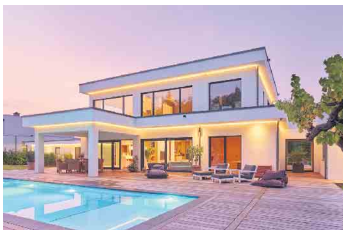
„Die Bauhausarchitektur ist Ausdruck von Individualität und Stilsicherheit.“

zent schlüsselfertig oder in einem weit fortgeschrittenen Maß bezugsfertig ausgeführt. „Auch das passt in die heutige Zeit, in der viele Familien zeitlich immer stärker eingespannt sind oder das Mehr an Komfort besonders schätzen. Mit einem schlüsselfertigen Holz-Fertighaus kommen sie entspannt und planungssicher in ihrem individuellen Traumhaus an“, schließt Tews. (BDF/FT)