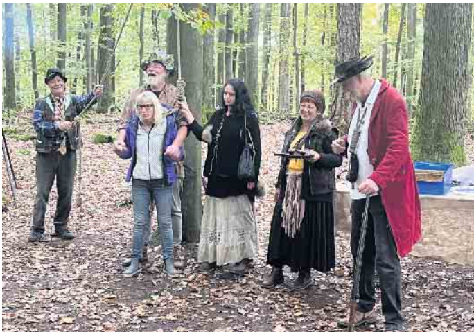
„Urplötzlich“ wurde die Reisegruppe der FBG Reichshof auf der Anfahrt „überfallen“.

cken Dinner am Freitagabend im Restaurant der Unterkunft, beim zünftigen Hüttenschmaus am Samstagmittag im Gasthof „Zur Geißhöhe“ oder am Abend bei der von Live-Musik begleiteten Weinprobe mit Vesper im urigen Gewölbekeller des Hotels.