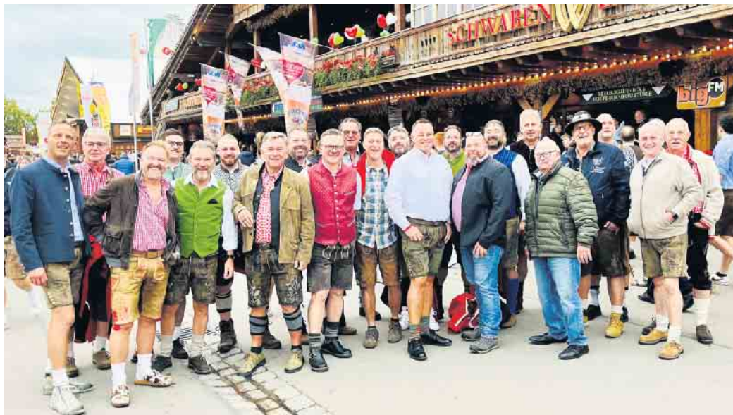
Die Senatoren aus Denklingen besuchten die Cannstatter Wasn.