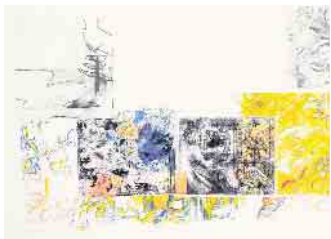
Der Digitaldruck trägt den Titel: „Vögel berauschend, 2024“.