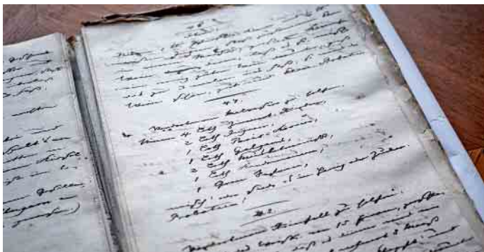
Das älteste bekannte Glühweinrezept Deutschlands stammt aus Radebeul, malerisch gelegen vor den Toren Dresdens.

Eine Spur führt ins sächsische Elbtal und fast 190 Jahre zurück