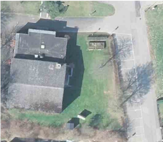
Rechts im Bild die vorhandenen Parktaschen

Die Gemeinde Reichshof begann Anfang November eine kleine Baumaßnahme am Schulstandort in Wildbergerhütte. Dort wird seit längerem über eine beengte Parkplatzsituation an der Schule geklagt und die Verkehrsströme auf der Schulstraße sind aufgrund der örtlichen Gegebenheiten nicht optimal. Außerdem befindet sich die Sanierung des Schwimmbades in Planung und dafür sind Fördermittel aus zwei verschiedenen Töpfen beantragt worden. Noch vor dem Winter soll daher hier die vorhandene Hecke gero-