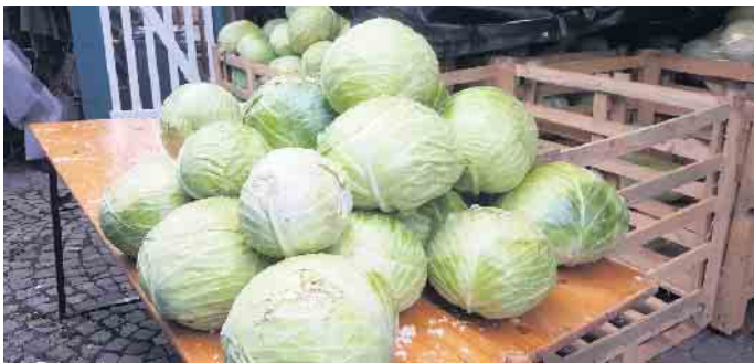
Die Bio-Kohl, kurz vor der Verarbeitung

te Speise, die in kleinen Portionen auch mit nach Hause genommen werden kann (solange der Vorrat reicht). Auch gibt es Herzhaftes aus der Museumskche und frisches Brot aus dem museumseigenen Backes. Ein kleiner Markt im Auengelnde mit handverlesenen Waren bereichert den Besuch des Kappesfestes. Die gesamte Anlage des Bauern-