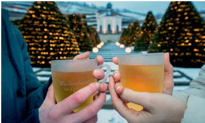
Ob weiß oder rot, in der kalten Jahreszeit sind wärmende Getränke gefragt.

Nachdem die Winzer von Schloss Wackerbarth dieses besondere Rezept entdeckt hatten, passten sie es behutsam dem heutigen Geschmack an. Aus ausgesuchten Weißweinen, Traubensaft und feiwürzenden Zutaten kreierten sie ein feinfruchtiges Wintergetränk. Das Ergebnis heißt heute „Wackerbarths Weiß & Heiß“ und ist neben anderen erlesenen Spezialitäten unter shop.schloss-wackerbarth.de erhältlich. Auch vor Ort gibt es im Winter einen besonderen Genuss: Europas erstes Erlebnisweingut verwandelt seine Anlage und die Weinberge von November bis Februar in eine märchenhafte Welt aus Licht, Musik und Genuss. (DJD)