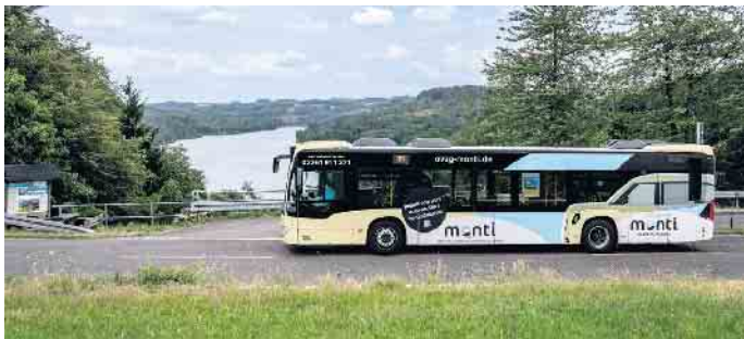
Auch bei den Linien 303 und 345 kommt es zu Verbesserungen.

Weiterhin kommt zu folgenden Verbesserungen: - Linie 303: Zusätzliche Fahrt nach Waldbrol ab Denklingen um 14.29 Uhr. - Linie 311: Die Fahrt um 12.20 Uhr ab Waldbrol wird bis Wilkenroth verlängert. - Linie 345: Zusätzliche Fahrt ab Waldbrol nach Eckenhausen um 12.15 Uhr.